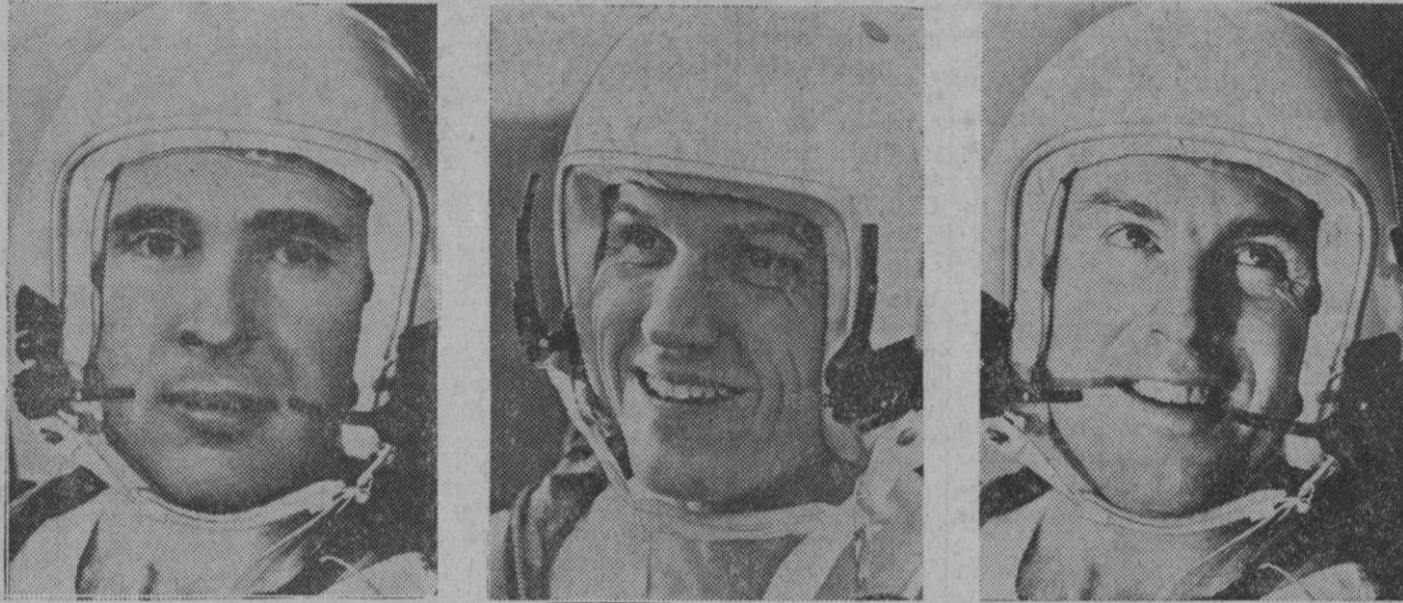
William Anders, Frank Borman y Jim Lovell, los tres astronautas que han sido lanzados en vuelo espacial hacia la Luna, a la que circunvalarán en varias órbitas antes de su regreso a la Tierra. ¡Navidad lunar para tres hombres!

Después de dos horas y media de girar en torno a la Tierra tomarán la dirección de la Luna