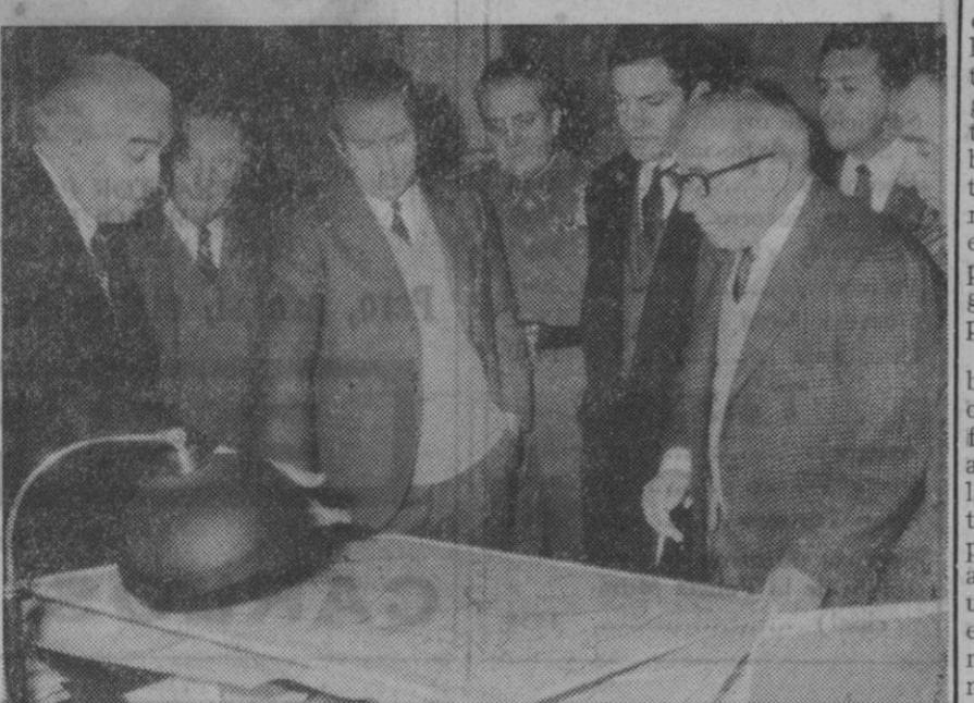
El señor Samaranch examina en el Ayuntamiento, con el gobernador, alcalde y otras personalidades el plano de urbanización de la ciudad.