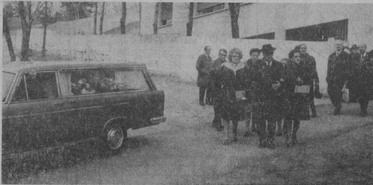
Madrid.—Momento de la salida del cortejo fúnebre del que fue ministro de Defensa del llamado Consejo Nacional, don Casimiro Casado, que murió el pasado día 18 en Madrid.

La revista sigue diciendo que en el interior del dobladillo irán bordadas en azul los nombres de los contrayentes y la fecha de la boda.—Efe.