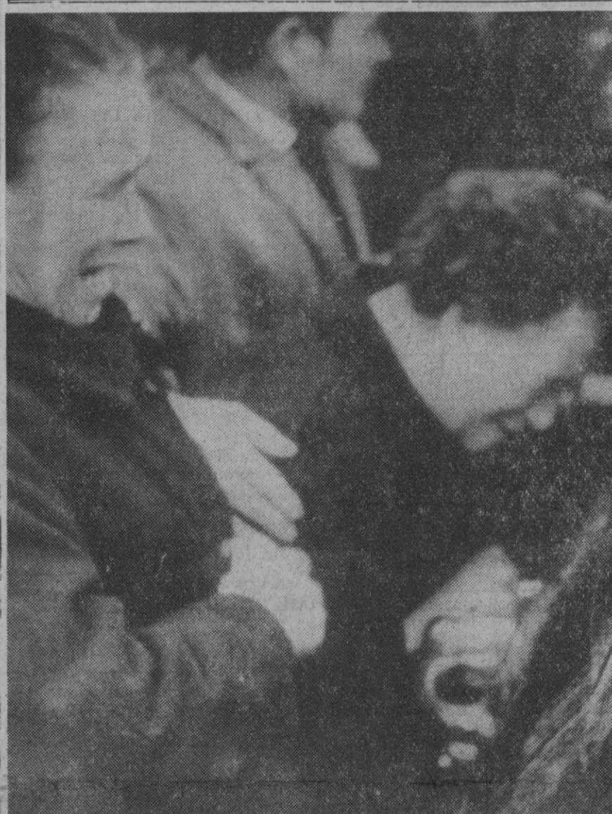
Bilbao.—Los familiares de los diez marineros muertos en el naufragio del "Diane", en aguas holandesas, reciben con visibles muestras de dolor los restos de aquéllos, que llegaron al aeropuerto de Sondica en vuelo desde Amsterdam.

«Nuestros enemigos cargarán con la responsabilidad»