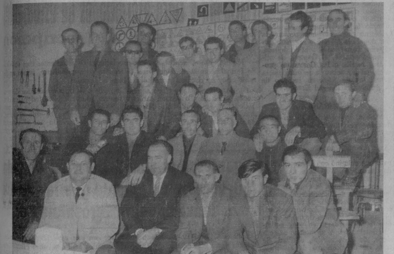
Abades.—Ha sido clausurado un curso impartido por el Programa de Promoción Profesional Obrera, en la especialidad de tractorista manipulador, para dieciocho alumnos. Al acto asistieron el gerente provincial del P. P. O., el alcalde y otras autoridades locales, se dirigieron a los asistentes durante el acto, el gerente, el alcalde, como algunas de las autoridades locales, se dirigieron a los asistentes para felicitar a los alumnos y agradecer al P. P. O. la labor realizada.