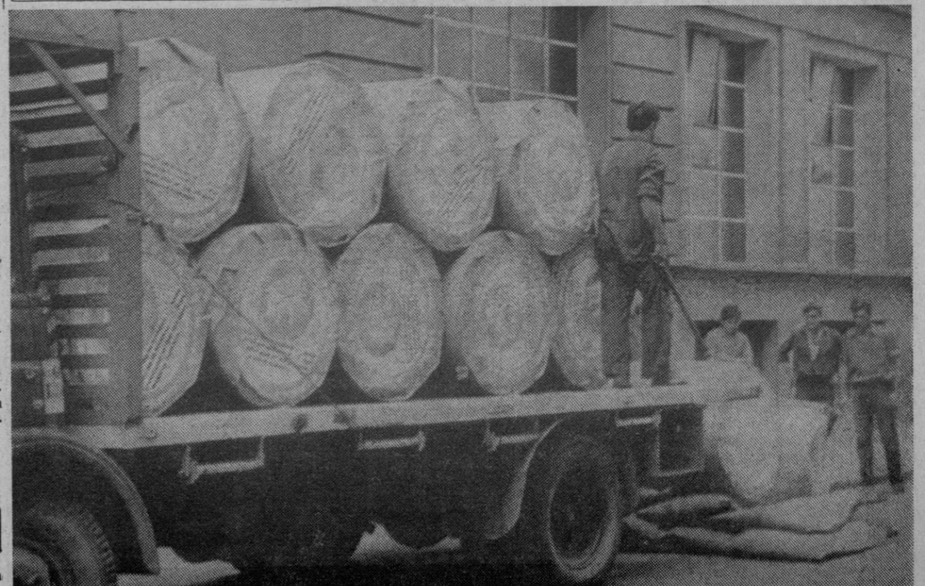
Madrid.—Camiones descargan bobinas de papel ante los talleres del diario «Madrid» que se espera salga de nuevo a la calle para el próximo treinta de septiembre o uno de octubre tras cumplir la suspensión de cuatro meses.

Se desconocen detalles sobre el número de heridos.—Efe-Reuter.