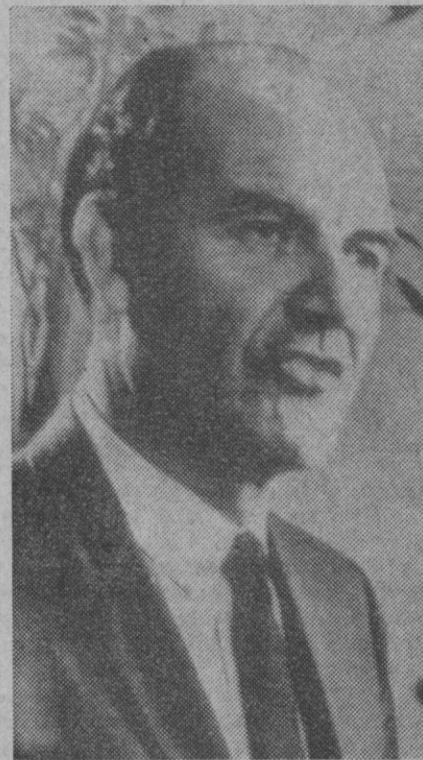
Este es el senador George S. McGovern, nuevo candidato demócrata a la Presidencia de EE. UU., que ha decidido presentarse porque dice tiene que acabar con la guerra de Vietnam para arreglar los problemas internos del país.

Hubert H. Humphrey continúa siendo el candidato favorito y los partidarios de McCarthly pretenden llegar a una fórmula de compromiso.