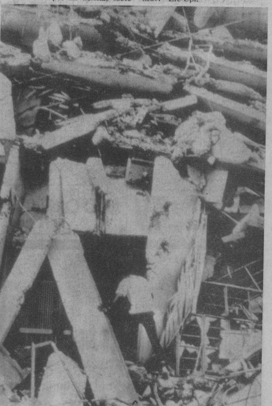
Manila.—En este estado quedó el edificio de cinco plantas que se derrumbó estrepitosamente durante un temblor de tierra ocurrido en Manila. Un hombre se aventura en el interior de los escombros para tratar de auxiliar a las víctimas atrapadas en el desplome del edificio.—(Telefoto Ap. Europa Press)

Los detalles de la muerte de Hitler y Eva Braun han sido revelados en un libro escrito por un ex oficial de los servicios soviéticos de inteligencia, titulado “La muerte de Adolfo Hitler”.—Efe-Reuters.