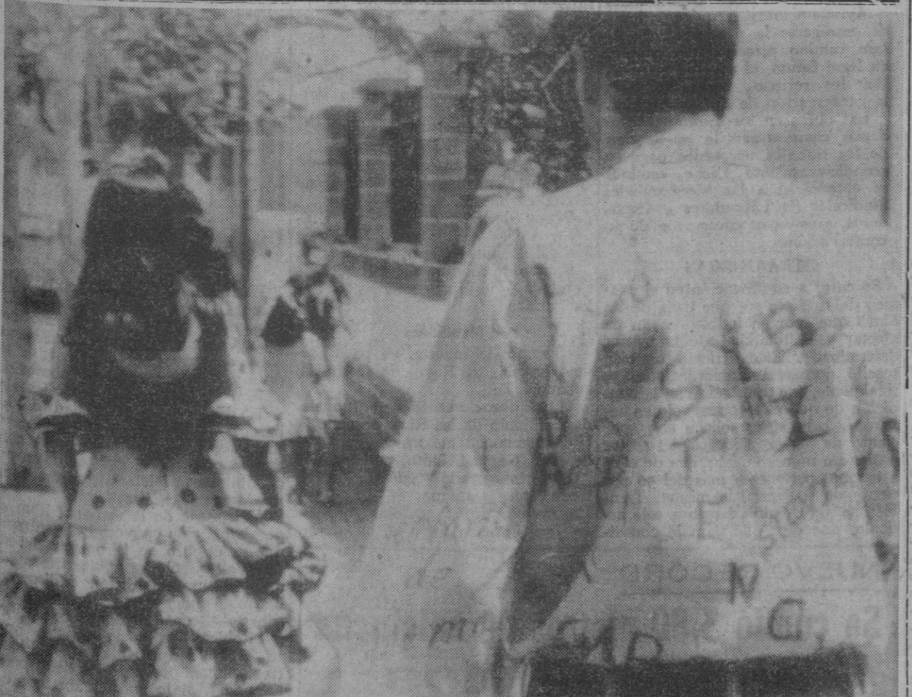
Cada época engendra una versión moderna del Casanova, del que pudiéramos llamar «profesional», de que va por la vida llevándose los jirones del corazón de las mujeres que han tenido relación con él. Desde el trovador que musicaba sus versos escritos en honor de una dama casi siempre indiferente a las cuitas del amante, desde el «tuno» alegre y billanguero que se adorna con las cintas multicolores en las que unas manos que se acaban de abrir a la vida del amor han escrito unos nombres que ondearán al viento del recuerdo; desde el trovador y desde el «tuno» hasta la última edición del «beatnik».

Ya a nadie se le ocurre poner nombres femeninos a las cintas de las capas, pero ellas hacen impacto en las camisas de ellos como es el caso de la foto que comentamos. Catherine, Natah, Sybille, Tenchi, Sophie, Silvio, Lynda. Sim y unos etcétera muy extensos y bellos se salpican por la fibra poliestérica de la camisa de este joven que piensa a la vez, y escribe en una de sus mangas que «l'amour est enfant de bohème», que traducido viene a decir algo así como que «el amor es niño bohemio».