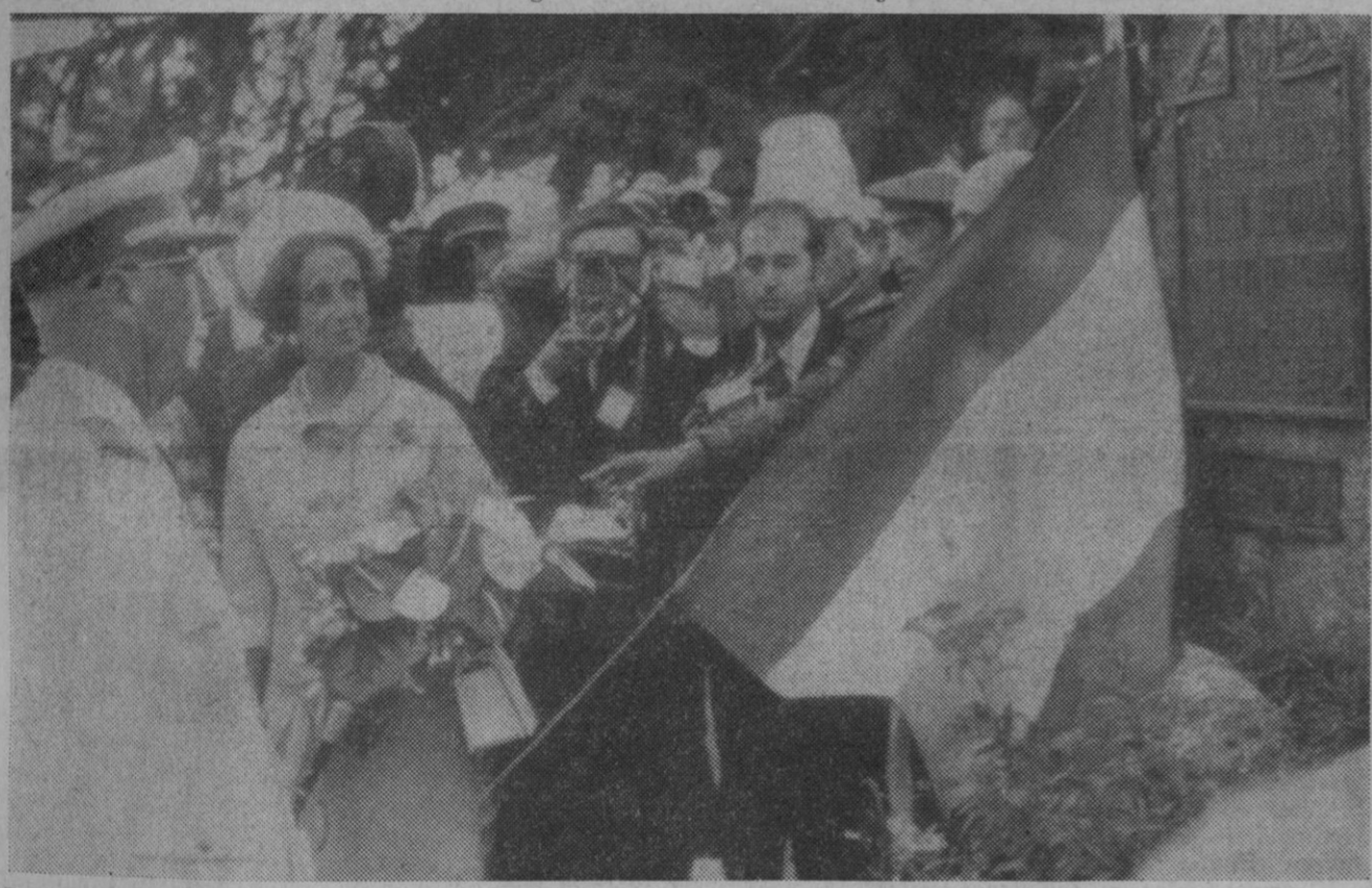
Burgos.—El Jefe del Estado descubre la lápida conmemorativa de la inauguración del ferrocarril Madrid-Burgos poco después de su llegada a esta última ciudad.

Persiste la gravedad del ilustre purpurado, pero no se han manifestado complicaciones de ningún género.—Cifra.