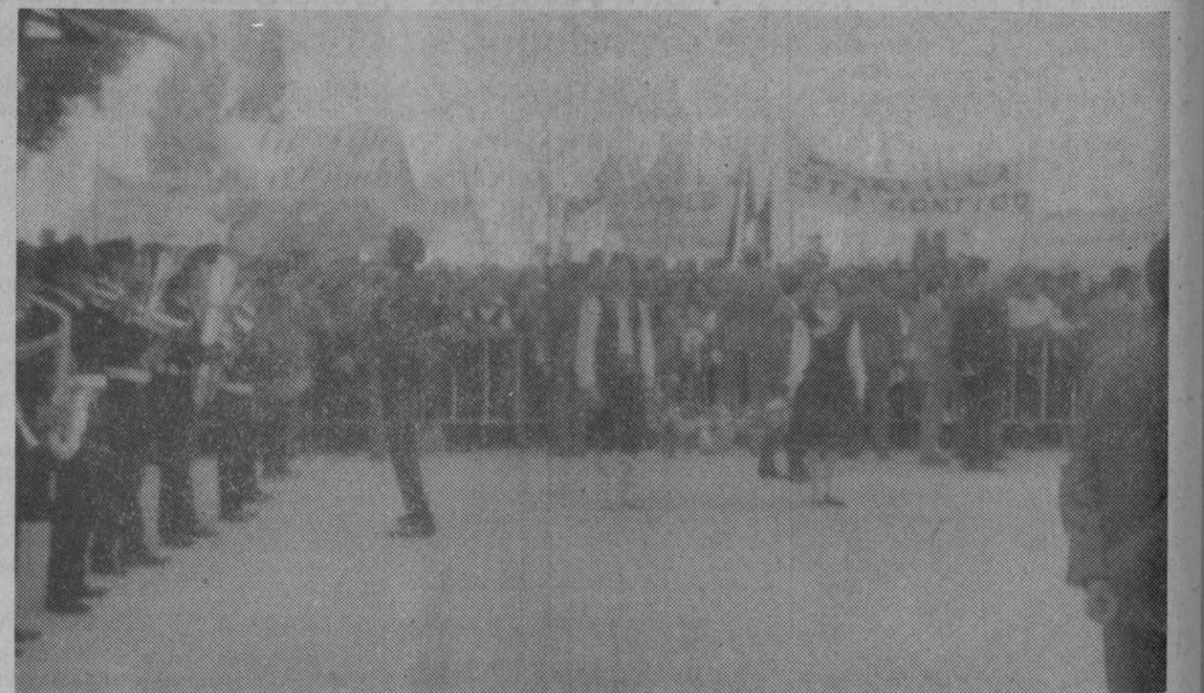
Vista parcial del público congregado en las proximidades de la estación de ferrocarril de Turrubuelo, portando pancartas de adhesión al Caudillo. En primer término, a la izquierda, la banda de música de El Espinar, y a la derecha, la pareja de segovianos que ofrecieron a Su Excelencia una cesta con productos típicos de la tierra.