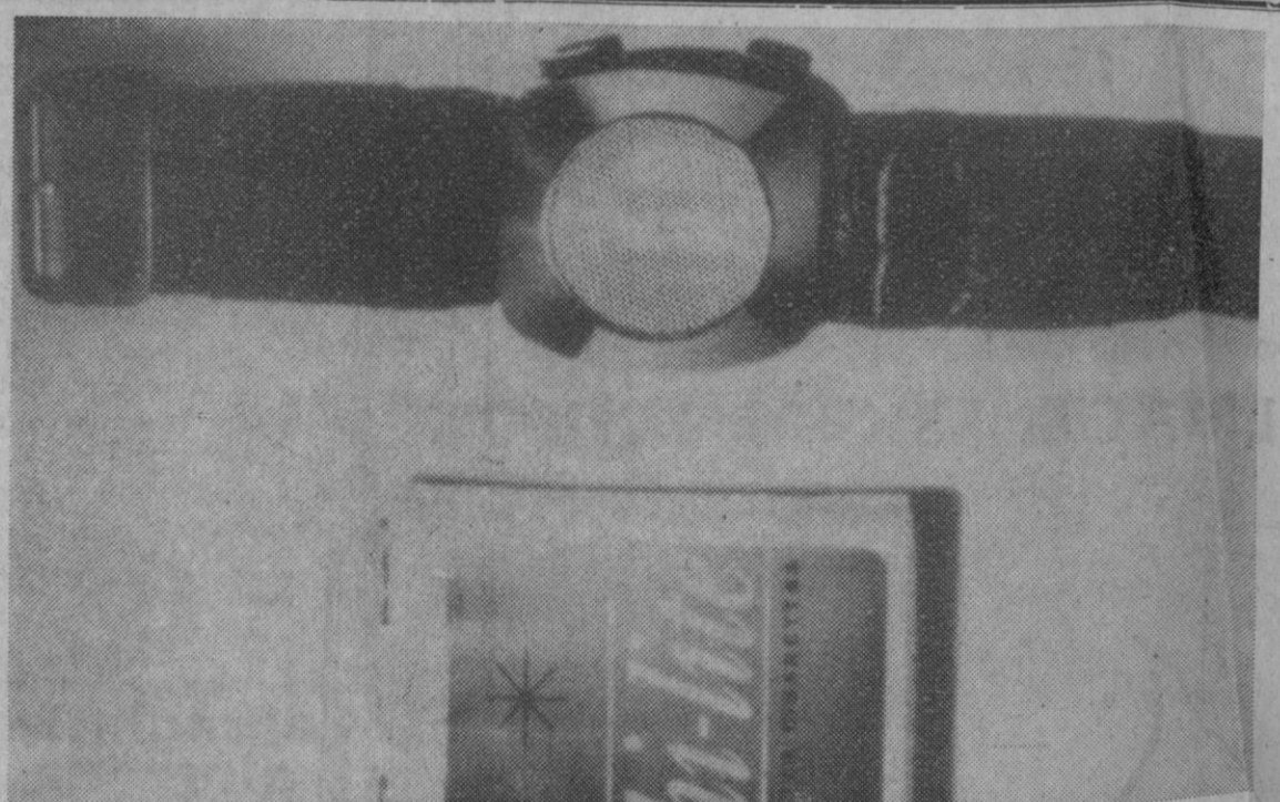
Tokio.—Primero se habló de radio, después de transistor, luego un transistor de bolsillo y, ahora, de un transistor de muñeca o de pulsera, puesto que como si fuera un reloj se puede llevar este pequeño producto de la más refinada técnica japonesa cuyo tamaño puede compararse con el del paquete de cigarrillos que aparece a la izquierda. Sus medidas son cuarenta y ocho por cuarenta y seis por dieciocho milímetros y opera con dos baterías de níquel-cadmio que le permiten funcionar durante ocho horas.