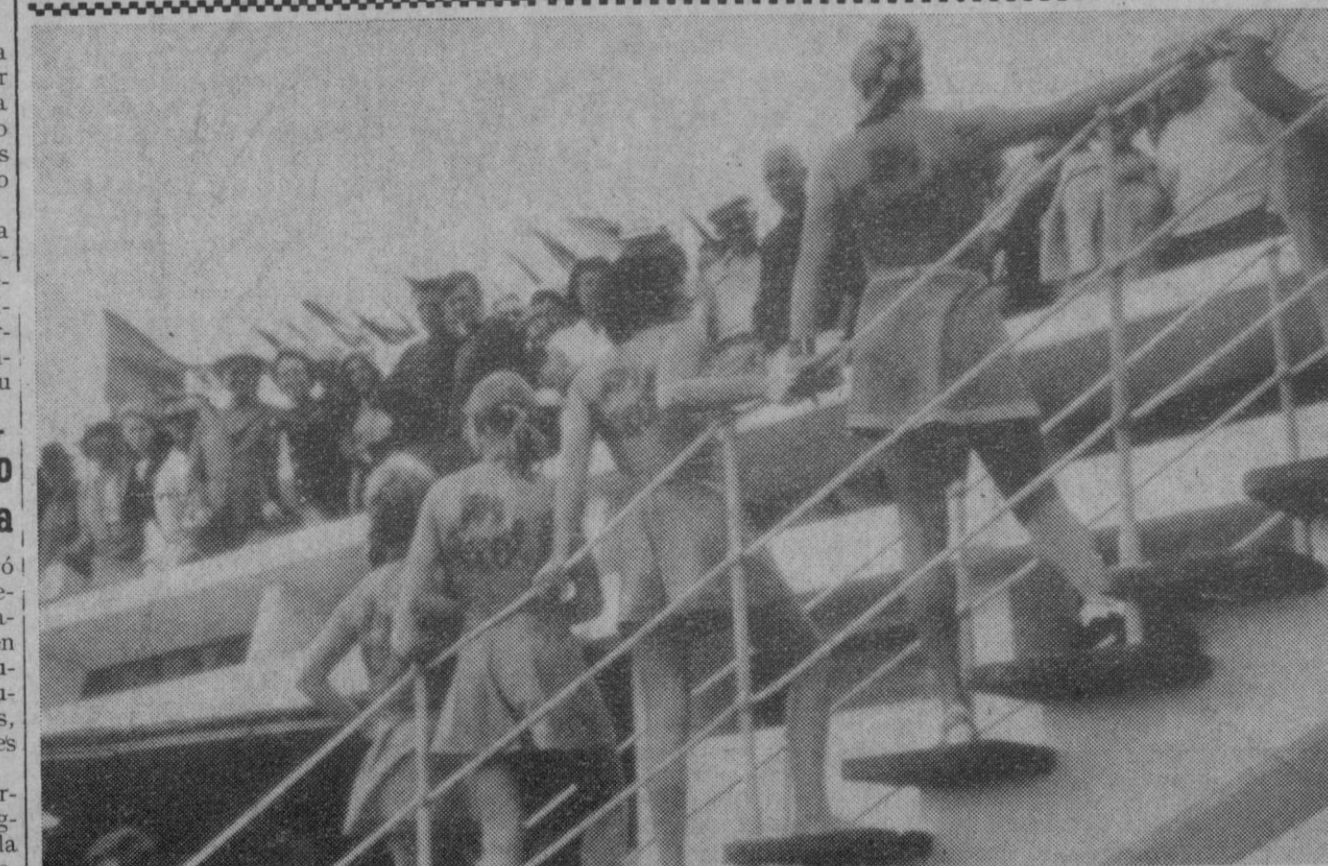
Barcelona.—Así, a base de utilizar las espaldas de las chicas guapas como encerado, se está lanzando una nueva película, «El magnífico Tony Carrara». Los anglosajones llaman a estas chicas que han sustituido al viejo hombre-anuncio o «sandwich», las «Tattoo girls». No dudamos de que esta forma de hacer publicidad debe dar muy buenos resultados, tan buenos como guapas sean las chicas que lucen sus encantos.

Después de instalado en el hotel donde se aloja, el primer ministro de Libia, salió de incógnito para realizar su primer recorrido por la ciudad y la isla.—Cifra.