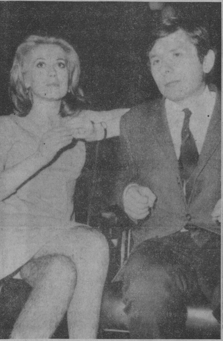
Catherine Deneuve, junto a Roman Polanski, durante una exhibición privada de «Repulsión».