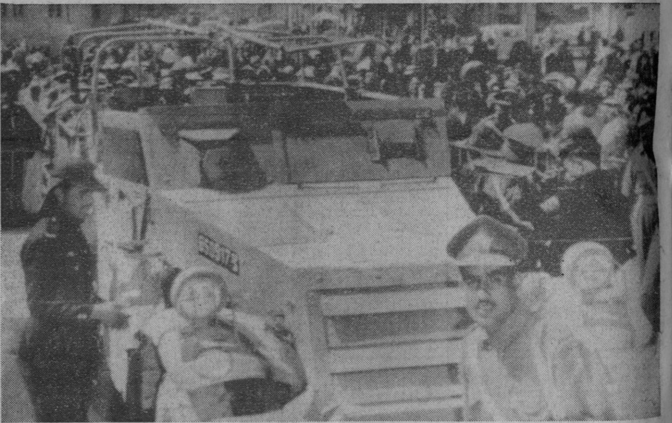
Amman.—Los jordanos contemplan en una plaza de Amman un vehículo israelí capturado cuando éstos atacaron la base de El Fatah.—(Telefoto AP-Europa Press)

Zurich (Suiza), 26.—El rey Constantino de Grecia y su esposa, la reina Ana María, han llegado esta noche a Zurich procedentes de Roma, según han anunciado las autoridades del aeropuerto de esta ciudad.—Efe-Reuters.