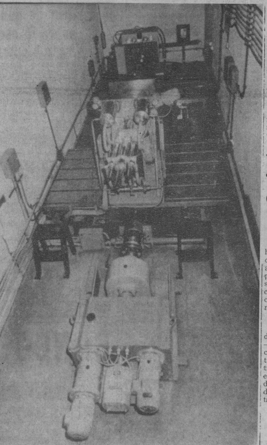
Madrid.—El “Coral I”, primer reactor rápido español que ha comenzado a funcionar en el centro “Juan Vigón” de la Junta de Energía Nuclear. Construido y proyectado casi en su totalidad por españoles, tiene una importancia fundamental para la mejor explotación de las centrales eléctricas nucleares.

Las mismas fuentes han indicado que aun dentro de las mayores posibilidades para que sea Massiel la intérprete de dicha canción, quedaban por concertar algunos detalles, que serán resueltos cuando hoy, en las primeras horas de la tarde, llegue al aeropuerto de Madrid, procedente de Méjico, donde se encontraba actuando. Por ello, agregan, puede considerarse que sea Massiel la intérprete de la canción que representa a España.—Cifra.