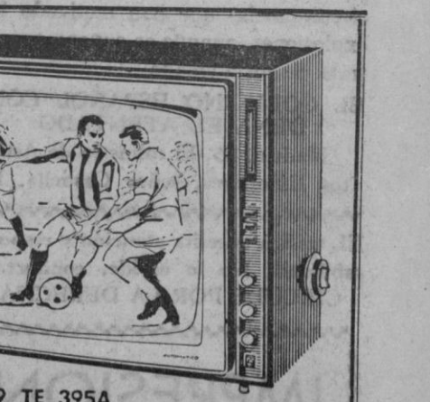
19 TE 395A