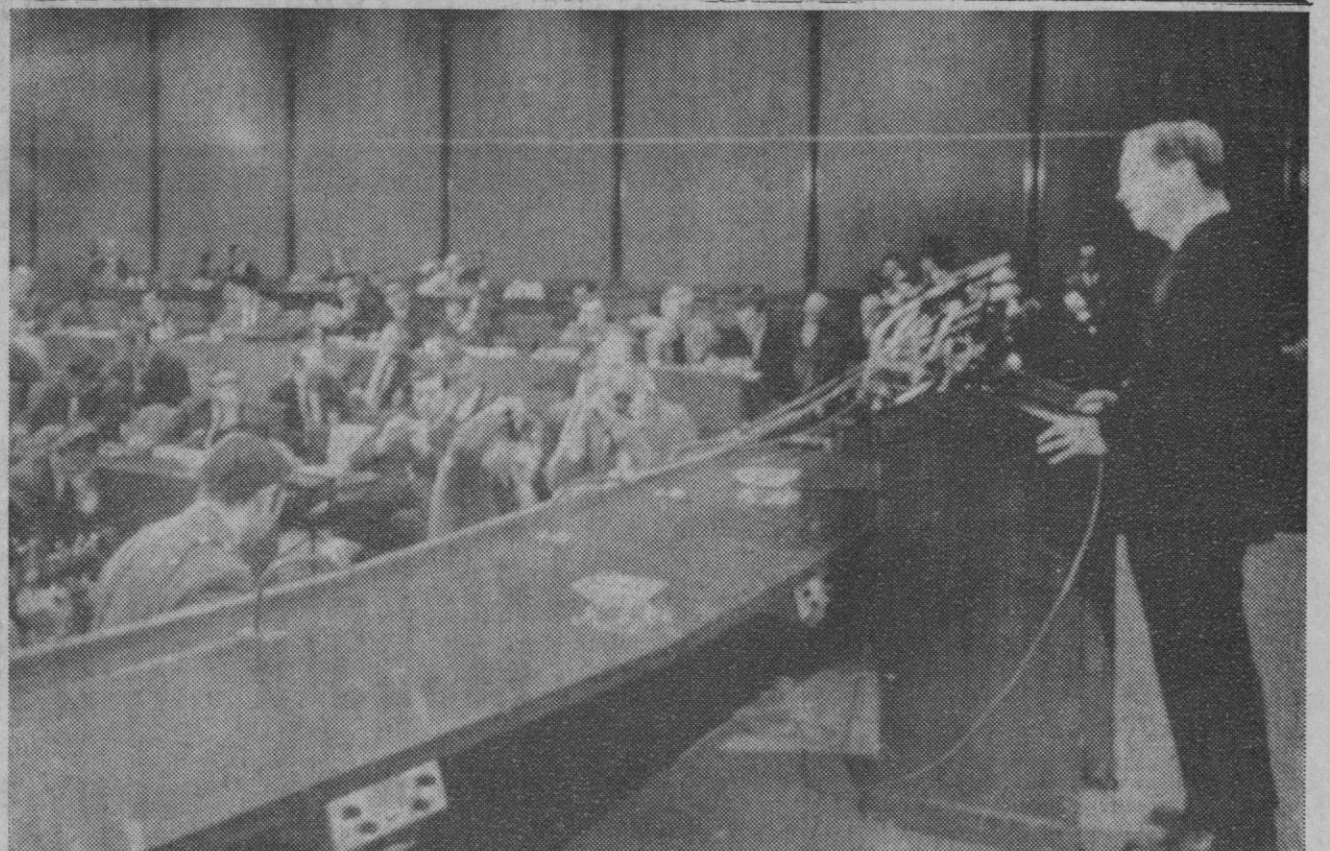
Washington.—William McChesney Martin, presidente del Consejo de Reserva Federal, anuncia que los representantes de las siete naciones del «pool» del oro se han puesto de acuerdo para organizar un sistema consistente en fijar dos precios para el oro para bloquear las compras especulativas del precioso metal. Martin ha hecho el anuncio tras una reunión de dos días del «pool».

París, 18.—Al equivalente de 200 francos franceses (40 dólares), fue limitada esta mañana en las oficinas de cambios de divisas en los aeropuertos y estaciones de ferrocarriles internacionales de París, la cantidad autorizada por persona.