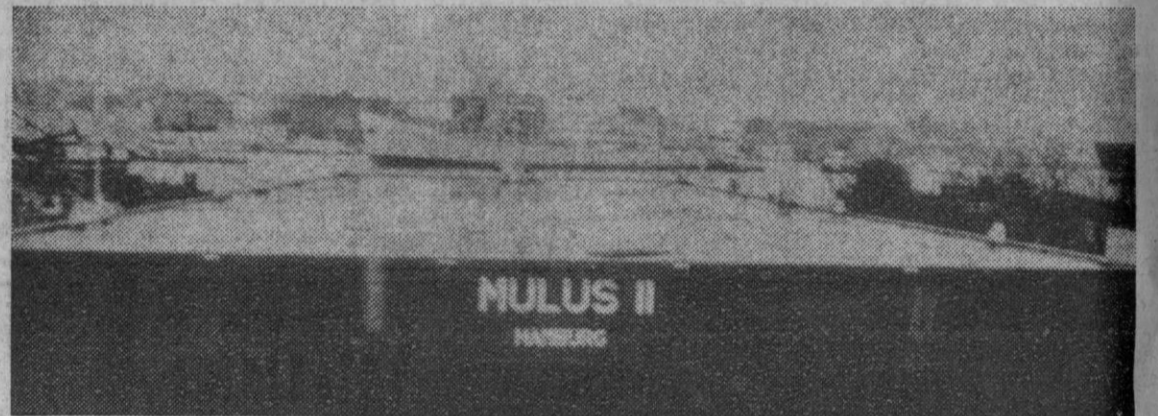
Hamburgo.—Este es el pontón "Nulus II", de este puerto, probablemente uno de los más grandes del mundo, construido para una empresa de salvamento. Mide 76 por 24 metros, tiene 480 y una capacidad de carga de cinco mil toneladas. Puede ser sumergido y metido bajo una carga voluminosa.

«Hoy está mucho más fuerte que ayer», señala su médico de cabecera.—Efe.