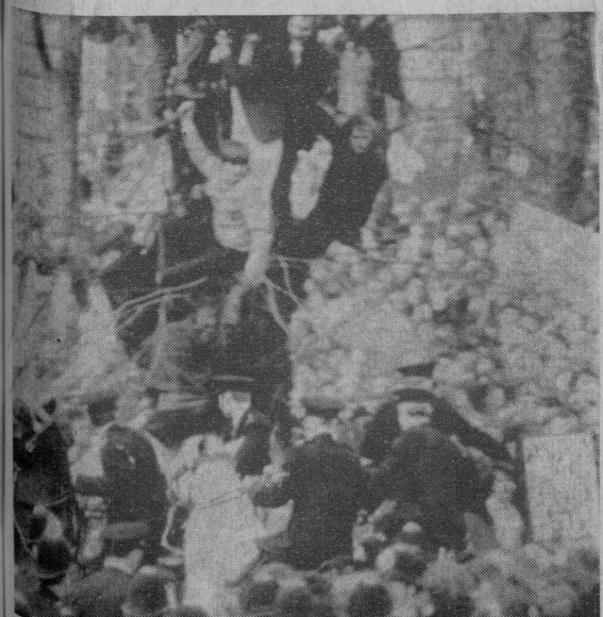
Londres.—Aspecto de uno de los violentos choques que se produjeron entre policías y manifestantes en el curso de una masiva protesta contra la guerra del Vietnam, ante la Embajada USA en la capital británica.

Roma, 18.—Noticias llegadas de Estambul dan cuenta de que treinta y cinco personas resultaron muertas y cuarenta y cinco heridas en un choque de autobuses que se produjo el domingo por la noche en Silivri, a 80 kilómetros al oeste de Estambul. El accidente se produjo cuando uno de los autobuses, que quería adelantar a un taxi, impidió el paso a otro autobús que venía en dirección contraria.—Efe.