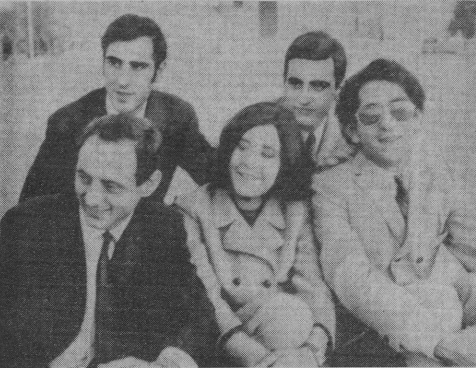
Las actividades se han multiplicado, y el éxito logrado hasta ahora puede aumentar, de seguro, de aquí en adelante. Vayamos con la lista:

Enero 1967.—Firman contrato de exclusiva discográfica con «Belter», y graban inmediatamente su primer redondo con cuatro éxitos internacionales.