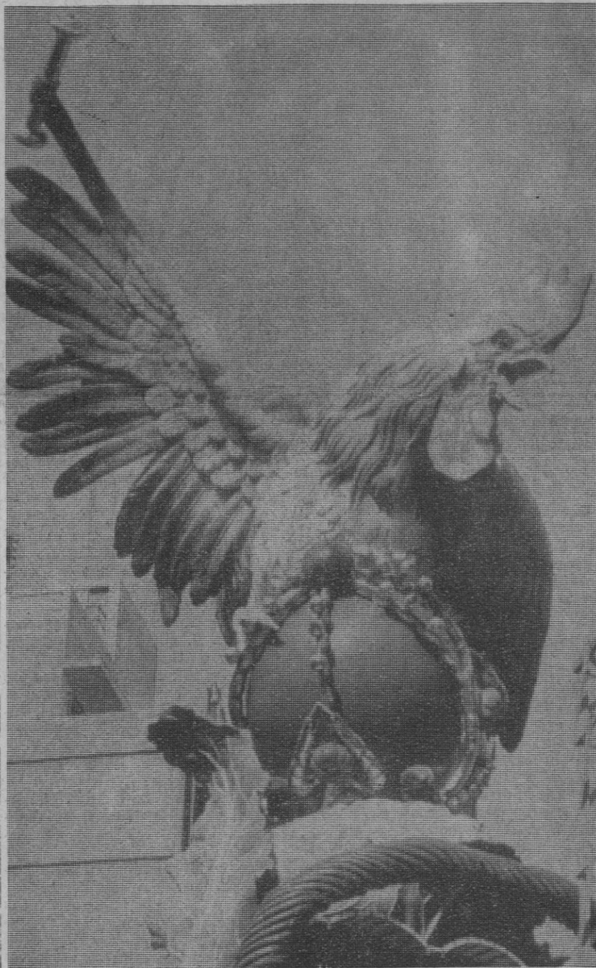
Valencia.—Aspecto parcial de la falla de Matemático Marzal, que ha sido levantada con vistas a las próximas fiestas de San José.

Nueva York, 15.—Los Estados Unidos han reafirmado hoy su determinación de mantener el precio del oro en 35 dólares la onza. El cierre momentáneo del mercado de oro de Londres, y de los Bancos del Reino Unido, anunciado para hoy viernes, no será obstáculo para que los Estados Unidos compren y vendan oro al precio oficial de 35 dólares la onza, han manifestado hoy el secretario del Tesoro Henry H. Fowler y el presidente del Consejo de la reserva federal, William McChesney Martin. Los Estados Unidos declararon anoche que el cierre del mercado del oro en Londres no significa la devaluación del dólar. La declaración ha sido hecha en un comunicado conjunto del Tesoro y del Consejo federal de la reserva.—Efe.