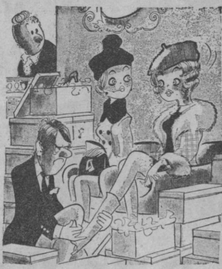
—Me gusta ver a los hombres a mis pies...

Quedan pocos días Tresillos más baratos que en fábrica MUEBLES «COOPERATIVA SAN FRUTOS»