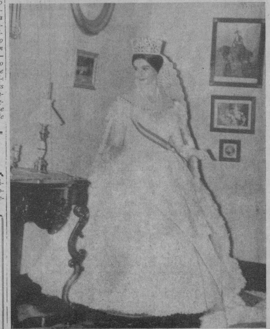
Granada.—En el Museo de la Dirección General de Turismo de la Casa de los Tilos ha quedado expuesta una completa reproducción en papel del atuendo que vistió la emperatriz Eugenia de Montijo, esposa de Napoleón III. La reproducción es de gran mérito y está siendo muy admirada.

El informante, que tiene acceso a los más altos círculos del servicio de información de Vietnam, cree que la batalla se librará probablemente en uno de estos tres escenarios: Khe Sanh, Quen Tri o Hue. Los tres están en la demarcación del primer cuerpo de ejército de Vietnam del Sur.—Efe-Upi.