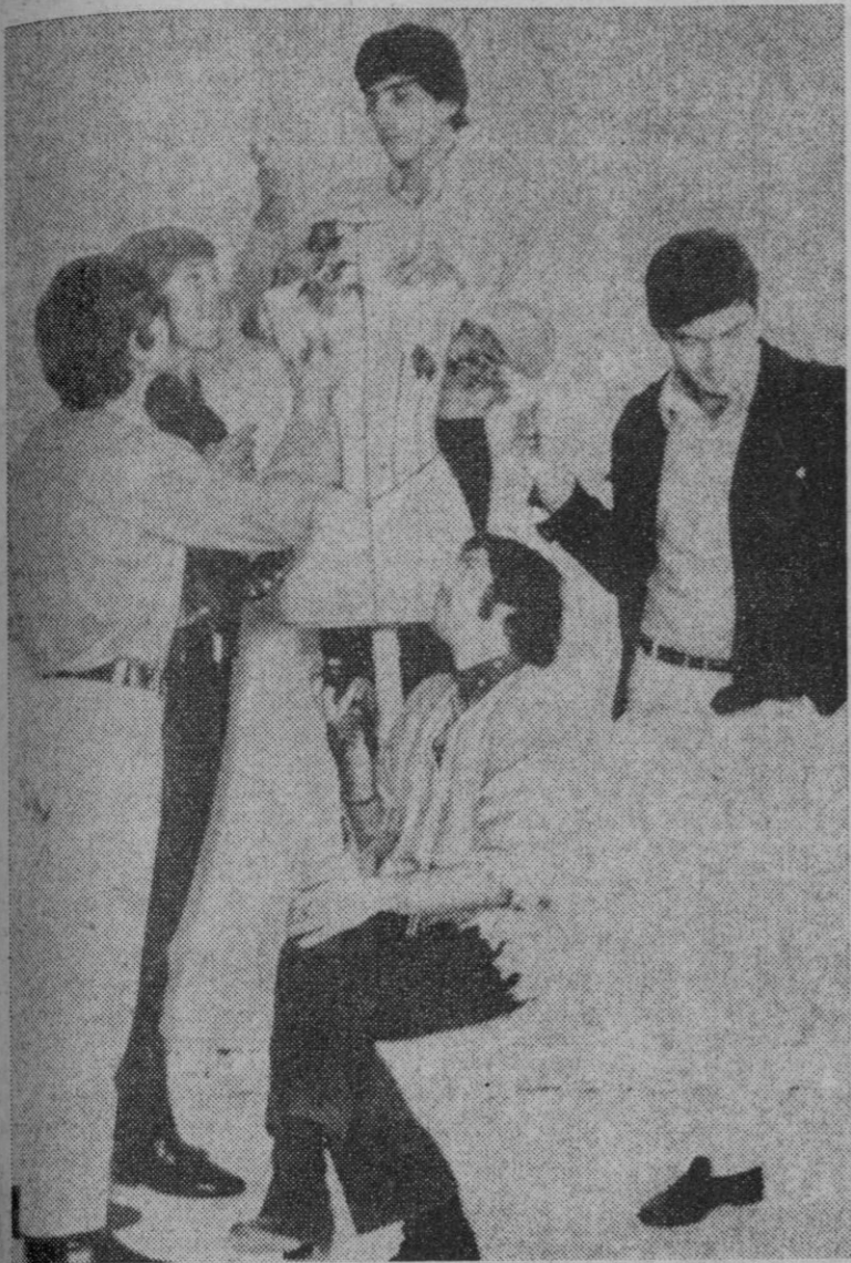
"Los Bravos", en una original composición fotográfica de Schommer