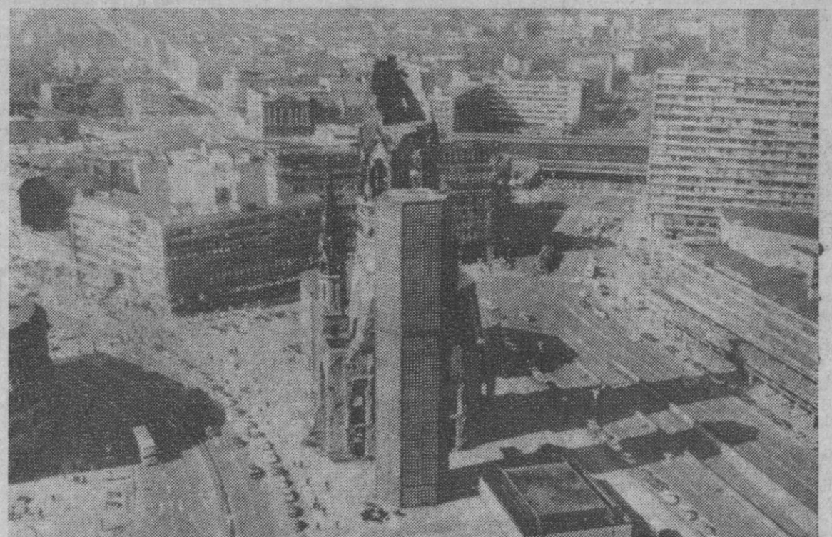
Vista panorámica del Berlín occidental, la ciudad dividida. En el techo de un rascacielos de 86 metros de altura en el «Europa-Center» se instalaron veinte telescopios. Nuestro fotógrafo apuntó su cámara sobre la iglesia conmemorativa Kaised Wilhelm, junto a la cual se reúnen la avenida Kurfürstendamm y las calles de Kent, Hardenberg, Tauentzien y Budapest.