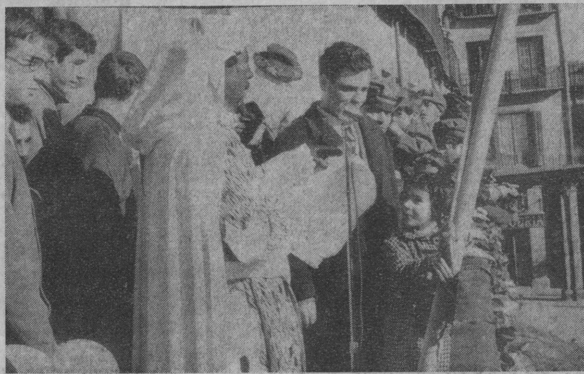
Desde el balcón principal del Ayuntamiento, el príncipe Altiar, embajador de los Reyes Magos, leyó el mensaje que Sus Majestades enviaban a todos los niños de Segovia, a quienes visitaron a última hora de la tarde de ayer y esta madrugada han dejado aquellos regalos que les habían pedido.

A pesar de haber solicitado su relevo, alegando su edad avanzada, el Papa le sigue manteniendo en su actual cargo pontificio, con el ruego reiterado de su todavía eficaz y necesaria colaboración.—Cifra.