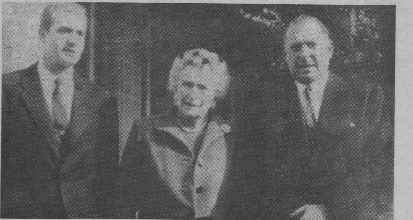
Lausanne.—La reina doña Victoria Eugenia de España ha cumplido ochenta años de edad y con este motivo se ha reunido con los miembros de la familia real española. En la foto aparece con su hijo, don Juan de Borbón, conde de Barcelona, y su nieto, el príncipe don Juan Carlos de Borbón.

La producción anual será de cinco mil millones de kilovatios y se espera que entre en funcionamiento en 1972. El proyecto correspondiente ha sido sometido a la aprobación del Ministerio de Industria, las instalaciones ocuparán una superficie de cuarenta hectáreas, aproximadamente, limitando con la zona térmica. Dará ocupación fija a más de 200 personas.—Cifra.