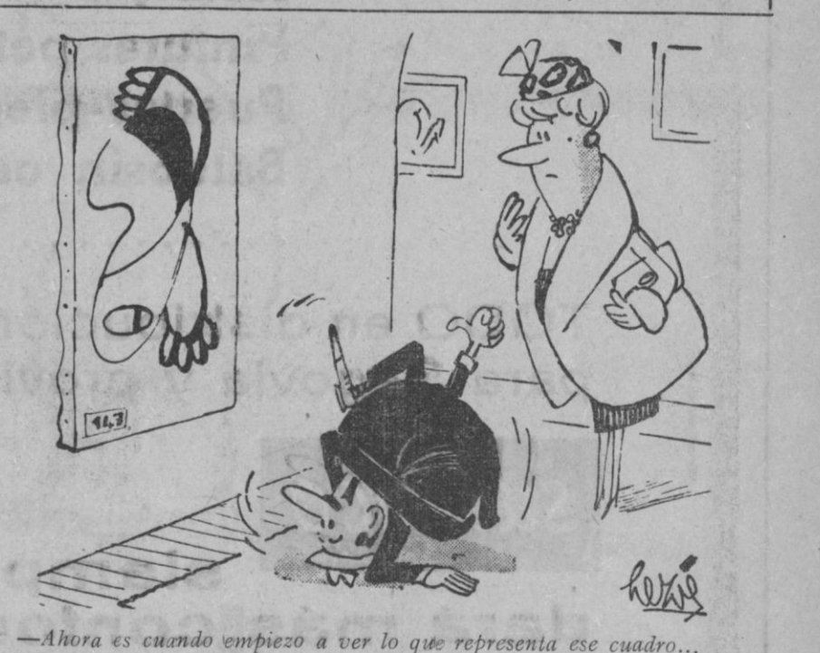
—Ahora es cuando empiezo a ver lo que representa ese cuadro...