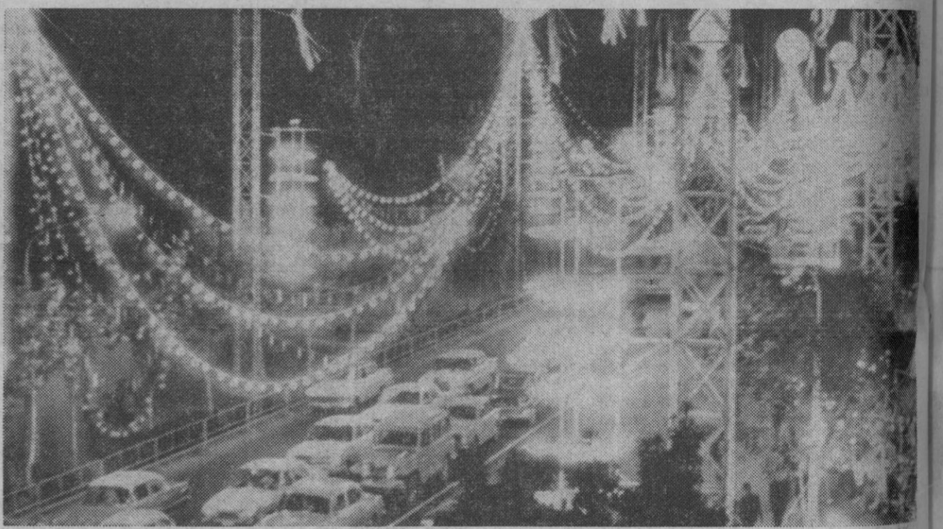
Teherán.—Gran cantidad de bombillas iluminan profusamente las calles de Teherán esperando el próximo día vintiséis en que el Sha de Persia y la emperatriz Farah serán coronados.

Después visitaron también las zonas más modernas de la ciudad y la autopista Génova-Sestri. Posteriormente el ministro español regresó a Roma en avión.