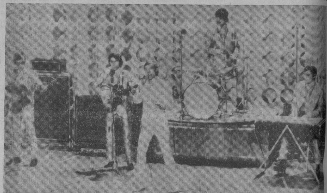
San Remo.—El conjunto español de «Los Bravos» durante su actuación en el Festival de la Canción de San Remo, con su canción «Uno como nosotros».—(Telefoto AP - Europa Press).

La sesión de apertura se celebró a las diez y media de la mañana.—