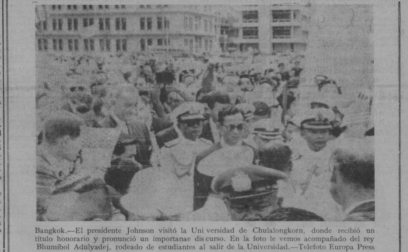
Bangkok.—El presidente Johnson visitó la Universidad de Chulalongkorn, donde recibió un título honorario y pronunció un importante discurso. En la foto le vemos acompañado del rey Bhumibol Adulyadej, rodeado de estudiantes al salir de la Universidad.

Tokio, 31.—Los científicos japoneses han lanzado hoy con éxito un proyectil espacial, el “Mu-1”, el mayor de todos los disparados hasta la fecha en este país, y el primero de una serie preparatoria al lanzamiento de su primer satélite a principios de 1968.—Efe-Reuter.