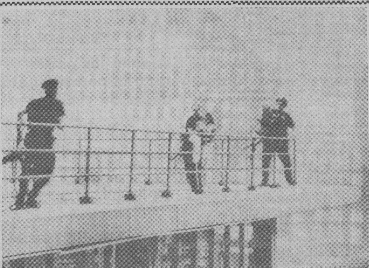
Nueva York, 22.—Policías de Nueva York sujetan a dos muchachas que se habían asomado a una peligrosa galería del piso 28 del "Hotel Americana" para poder ver a los "Beatles" alojados en el "Hotel Warwick", a la derecha, en primer plano.—(Telefoto AP-Europa Press)

Yakarta, 23.—Unas 20.000 personas son víctimas del hambre en la isla indonesia de Lo Bock, al este de Bali. Un funcionario de Sanidad de la isla, el doctor Mohamed Jusof, ha hecho un urgente llamamiento al Gobierno de Yakarta pidiendo el rápido envío de alimentos para ayudar a los hambrientos isleños. A no ser que la ayuda se reciba pronto—advirtió—, serán millares los afectados por mala nutrición.—Efe- Reuter.