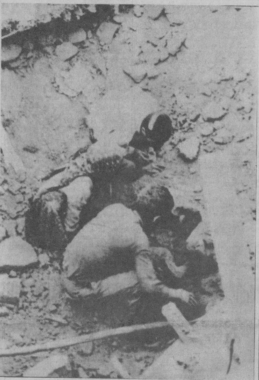
Varto (Turquía).—Entre las ruinas de lo que fue su hogar, estas personas buscaron los restos de sus familiares.

Entre Kuzmin, Gregor y Feil, parecen encontrarse los tres primeros puestos de la prueba. Hoy el soviético ha realizado la carrera que más le convenía y sin duda debe superar de largo su marca en la misma semifinal. Las posibilidades de nuestros representantes se ven muy comprometidas ante la opción a la final. Roig, parece ser nuestra mejor baza aunque hay que esperar que Pujol iguale, al menos, su récord de España 2-16-4.—Alfil.