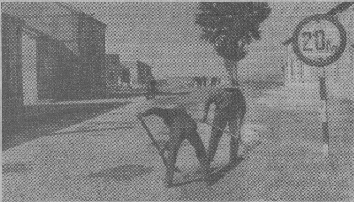
Brigadas de Obras Públicas vienen efectuando al presente la reparación, mejoras y ensanche de tramos en diferentes carreteras de nuestra provincia. La foto recoge un aspecto de los trabajos de rastreado y riego asfáltico en la de Cuéllar a Arévalo, llamada La Zamorana, a su paso por Arroyo de Cuéllar.