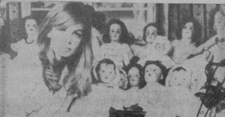
Jean Shrimpton, "La Gamba", posa entre muñecas.

ció en toda clase de publicidad: desde pastillas de jabón a automóviles «sports». Como Vivian Leigh, como Mathews, o como Townsen, Jean Shrimpton se había convertido en una figura «mito» de Inglaterra.