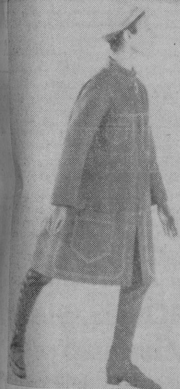
Original impermeable estilo marinero, en popelín de algodón con forro rojo brillante, con pespuntes en hilo blanco