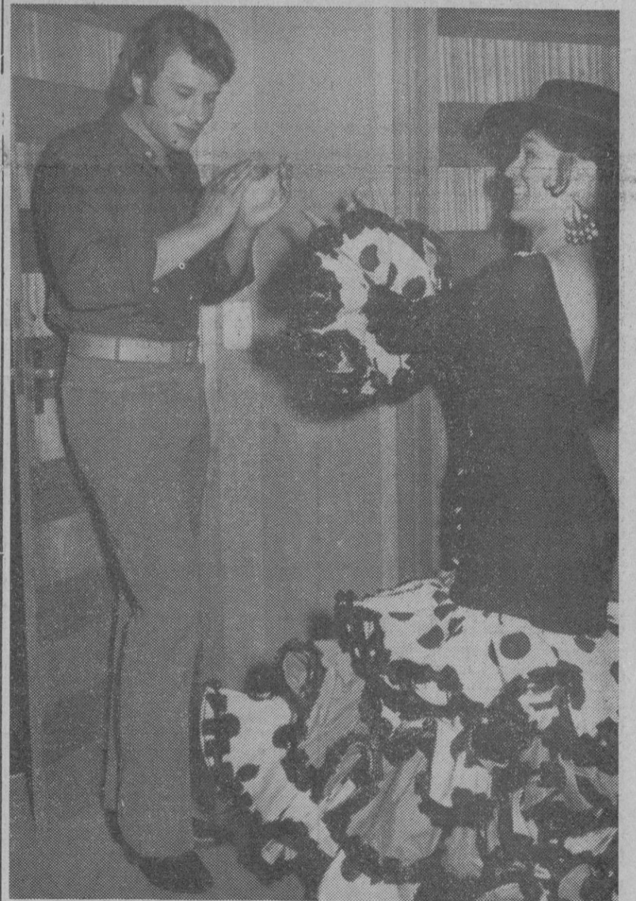
Llonet de Mar.—Se encuentra en la Costa Brava el conocido cantante francés Johnny Halliday, quien actuará en diversas salas de fiesta de las poblaciones de esta zona turística. En la foto, Johnny durante una de sus actuaciones.