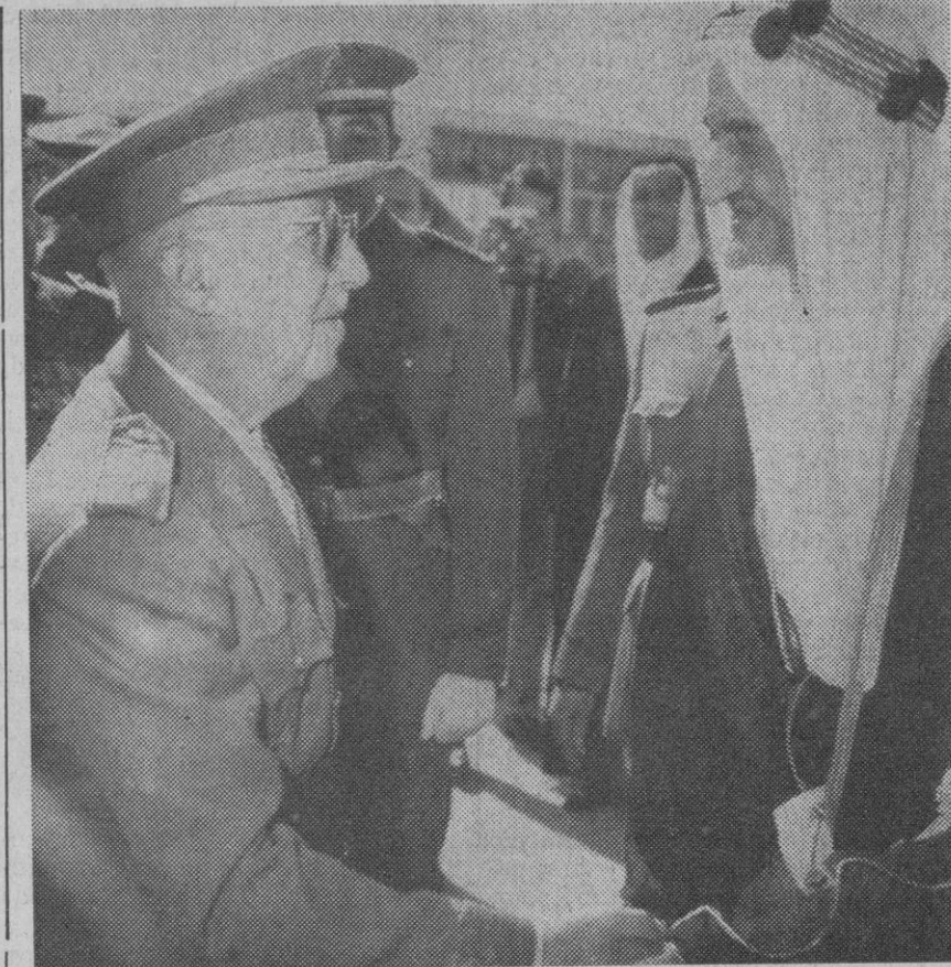
Madrid.—Su Excelencia el Jefe del Estado da una cordial bienvenida al rey Faisal de Arabia Saudí, a su llegada al aeropuerto de Barajas. El rey Faisal ha sido invitado por el Caudillo y permanecerá cinco días en España.