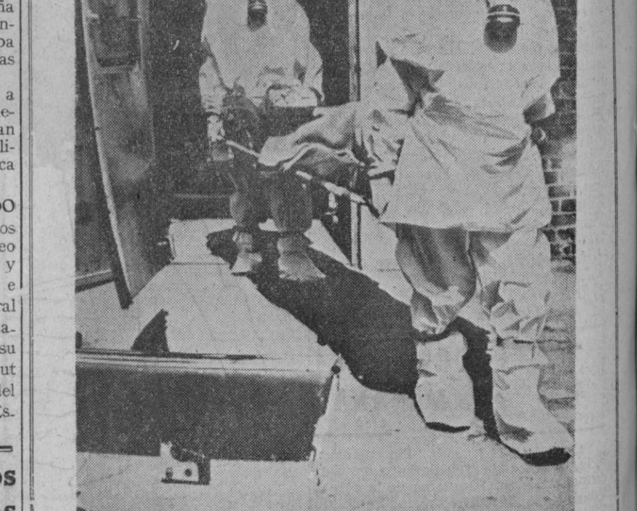
No se trata de astronautas ni de una escena de una película de ciencia ficción. Son especialistas en desinfección y camilleros que para el transporte de enfermos de viruela necesitan llevar estos trajes y máscaras respiratorias.

El perro «Him» cayó entre las ruedas de un coche cuando perseguía a una ardilla. Murió instantáneamente. Un portavoz de la Casa Blanca informó más tarde que las dos hijas del presidente, Lynda y Luci, se mostraban «muy tristes» por el hecho.—Efe-UPI.