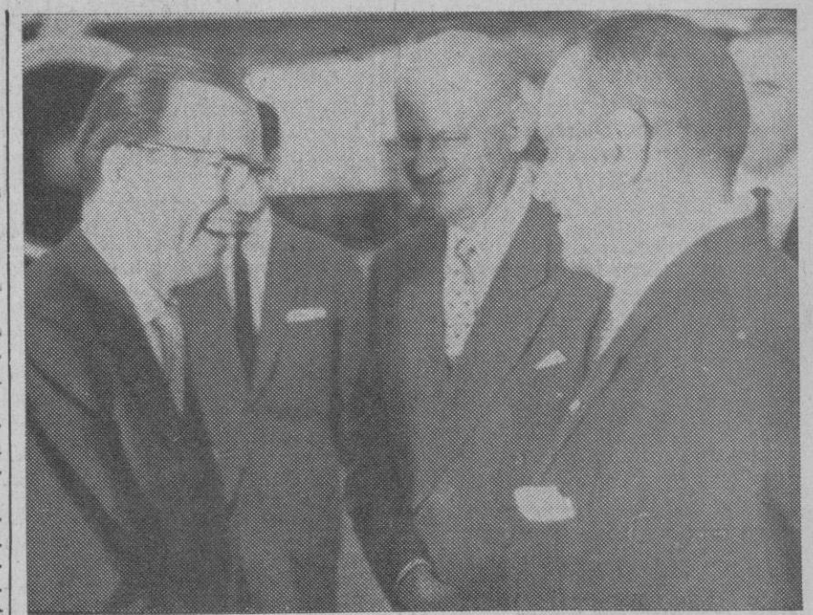
Madrid.—El subsecretario jefe del Departamento alemán de Prensa e Información, señor Karl-Gunther von Hase, estrecha la mano del ministro español de Información y Turismo, señor Fraga Iribarne, a su llegada a España. En la foto aparece también el embajador alemán en España.

A primera hora de la tarde el ministro de Información - Turismo, señor Fraga Iribarne, ofreció a su colega alemán una comida en la Hostería del Estudiante, de Alcalá de Henares, a la que asistieron el subsecretario del Departamento, personalidades del séquito del ministro alemán, directores generales de los Ministerios de Asuntos Exteriores y de Información y Turismo y otras personalidades.—Cifra.