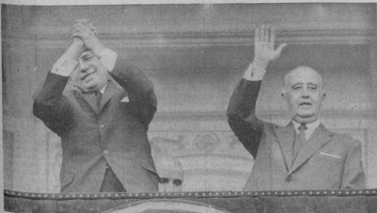
Su Excelencia el Jefe del Estado y el Presidente de Nicaragua presidieron la segunda corrida de toros de la Feria de San Isidro en Madrid, que tuvo lugar ayer, domingo, en la plaza de Las Ventas. Sus Excelencias, saludando al público que les aclamó durante la corrida.—(Foto Europa Press).

Poco después, cinco bonzos se adelantaron hacia el oficial de los «marines», los cuales les aseguraron que si les entregaban a los 14 desertores, no usarían la fuerza contra los budistas. Los bonzos entregaron a los 14 «marines» y exigieron que esta entrega constara por escrito firmado por oficiales y acto seguido los tanques y las tropas se retiraron.—Efe.