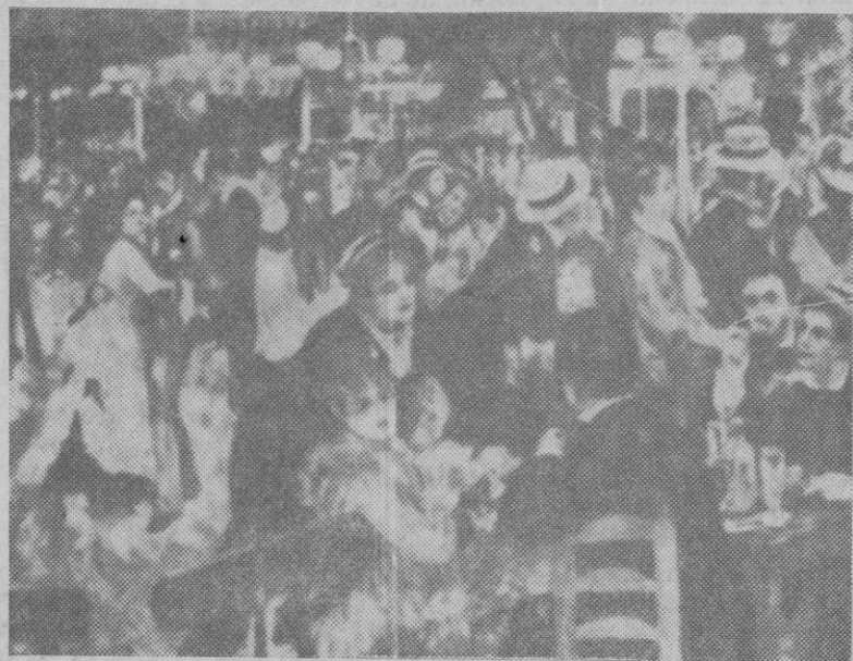
Un bello cuadro impresionista de Renoir

El fenómeno del impresionismo se produce en la pintura europea durante el último tercio del siglo XIX, momento en que se dan también otras corrientes artísticas muy importantes, como el academicismo.