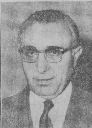
Salat Bitar, nuevo jefe del Gobierno sirio y, al mismo tiempo ministro de Negocios Extranjeros

Madrid, 18.—El próximo día 26 se celebrará sesión plenaria de Cortes, a la que serán sometidos los dictámenes sobre los proyectos de ley de reforma del sistema tributario de la Guinea Ecuatorial, el presupuesto de la Guinea Ecuatorial y el régimen financiero de los puertos españoles, según ha informado el presidente de las Cortes, D. Antonio Iturmendi, a los periodistas.—Cifra.