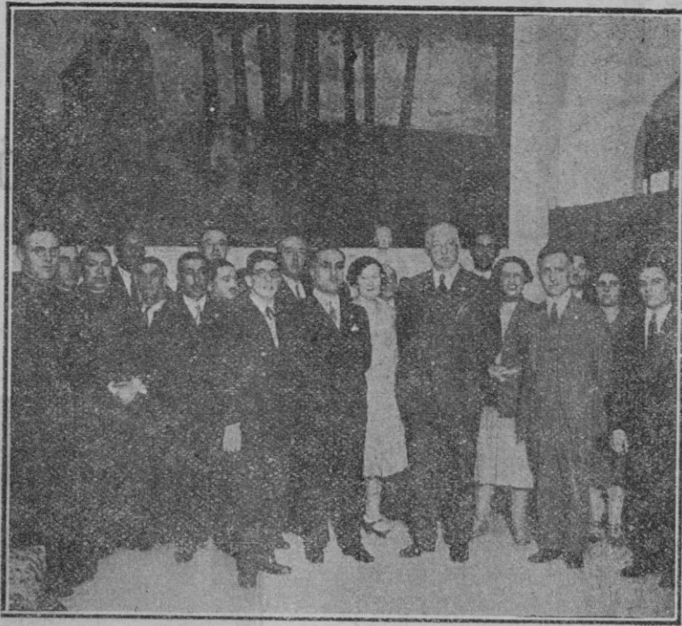
El general Primo de Rivera en el Balneario de Mondariz (Pontevedra) inaugurando la Exposición de obras de los artistas Pintos Fonseca y Narciso.