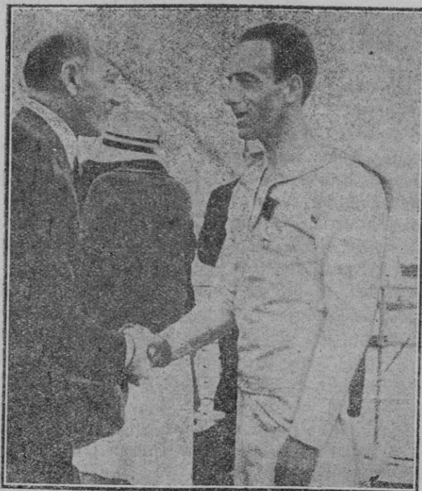
Alain Gerbault, el "navegante solitario", hablando con el representante del ministro de Marina francés, después de haber sido condecorado con la insignia de la Legión de Honor.