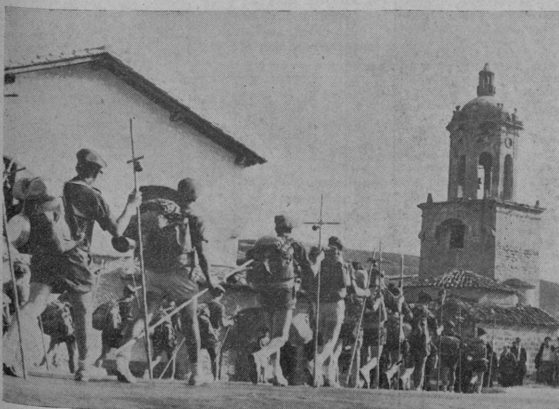
Apoyándose en el bordón, con los macutos a la espalda, vemos a los miembros de la Organización Juvenil Española que peregrinan a Santiago de Compostela desde Roncesvalles, siguiendo la ruta navarra, a su llegada a la localidad de Puente La Reina, paso obligado en la ruta jacobea.