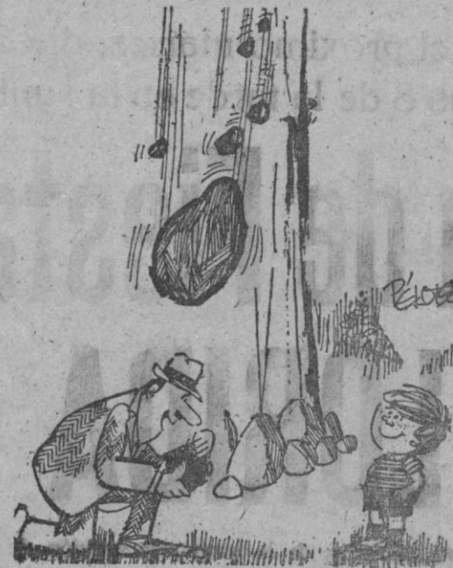
—Por fin te decides a sonreír...

MEJOR QUE LA REALIDAD Distribuidor exclusivo CASA SOLERA