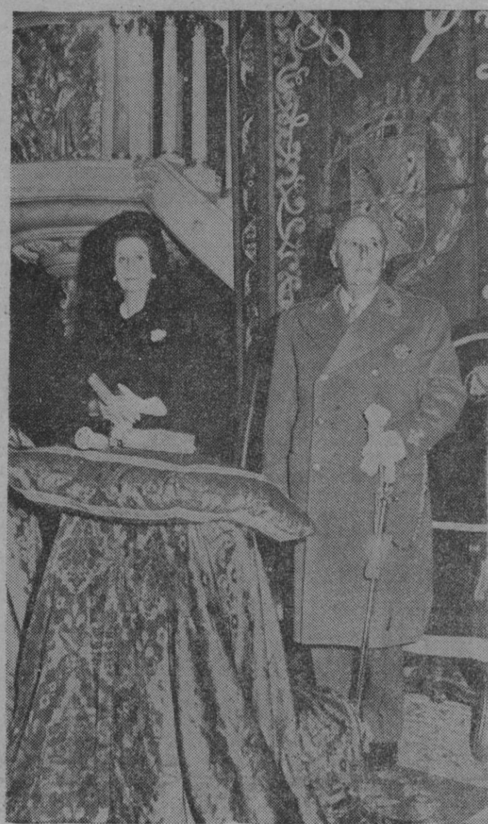
Su Excelencia el Jefe del Estado, acompañado de su esposa, en el símil de honor, durante la celebración de la misa solemne oficiada en la basílica de San Francisco el Grande, en Madrid, con motivo de la festividad de la Inmaculada, Patrona de la Infancia.

A preguntas de los periodistas anunció la posibilidad de que el día 22 se celebre otra sesión plenaria para someter a su consideración los proyectos que restan por emitir en las comisiones y el dictamen emitido ayer respecto del proyecto de ley de asociaciones. Cifra.