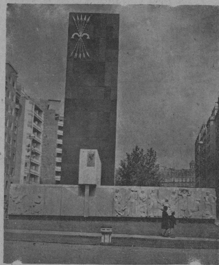
Monumento erigido a la memoria de José Antonio Primo de Rivera, que ha sido inaugurado en Barcelona, en un solemne acto presidido por el ministro secretario general del Movimiento, don José Solís Ruiz.

Zurich, 2.—El famoso corredor ciclista húngaro Hugo Koblet, vencedor de la Vuelta a Francia y del Giro de Italia, ha resultado gravemente herido en un accidente de circulación. El coche de Koblet sufrió un despiste en una curva entre Moenchaldorf y Esselberg, estrellándose contra un árbol. Koblet ingresó en el hospital cantonal con fractura de cráneo y otras diversas. Su estado fue calificado de grave.—Alfil.