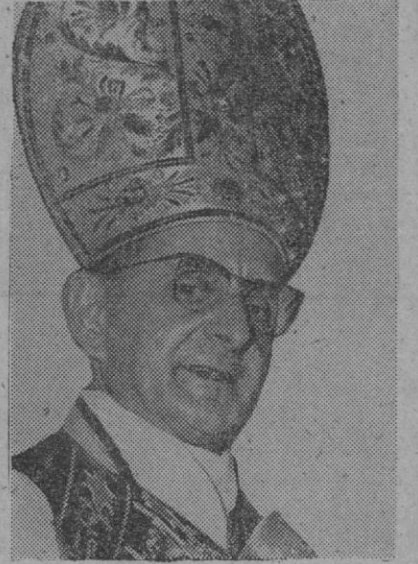
Su Santidad el Papa Pablo VI

Roma, 1.—El Papa Pablo VI ha visitado un cementerio situado en los suburbios de Roma a fin de orar por los difuntos.