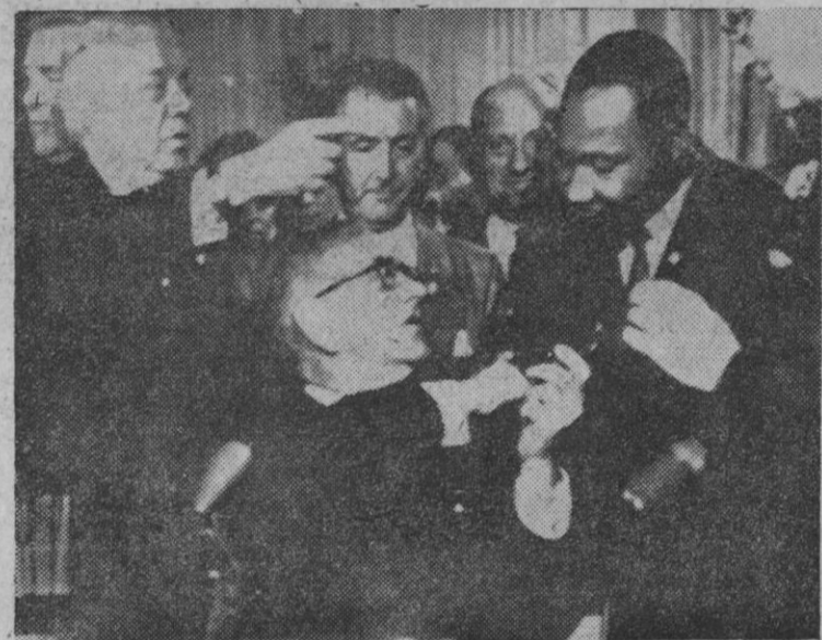
Washington.—El presidente Johnson ha firmado la ley de derechos civiles que intenta poner fin a la lucha racial en los Estados Unidos. En la foto, el presidente Johnson ofrece la pluma al líder integrista Martin Luther King.