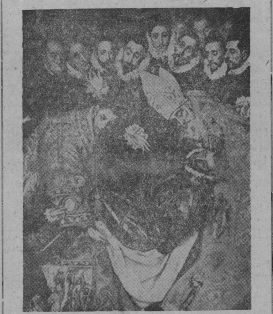
Toledo.—He aquí un detalle de «El entierro del Conde de Orgaz», de El Greco, a cuyo traslado a Nueva York, para ser exhibido en la Feria Mundial, se opone la Dirección General de Bellas Artes. Contra esta decisión podrá recurrir la Comisaría de la Feria.

Madrid, 26.—El próximo sorteo de la Lotería Nacional, especial y conmemorativo de los 25 años de paz española, que se realizará según el sistema moderno, tendrá lugar a las once de la noche, del próximo día 31, en el teatro del Ministerio de Información y Turismo, según resolución del Servicio Nacional de Loterías, que publica hoy el «Boletín Oficial del Estado».