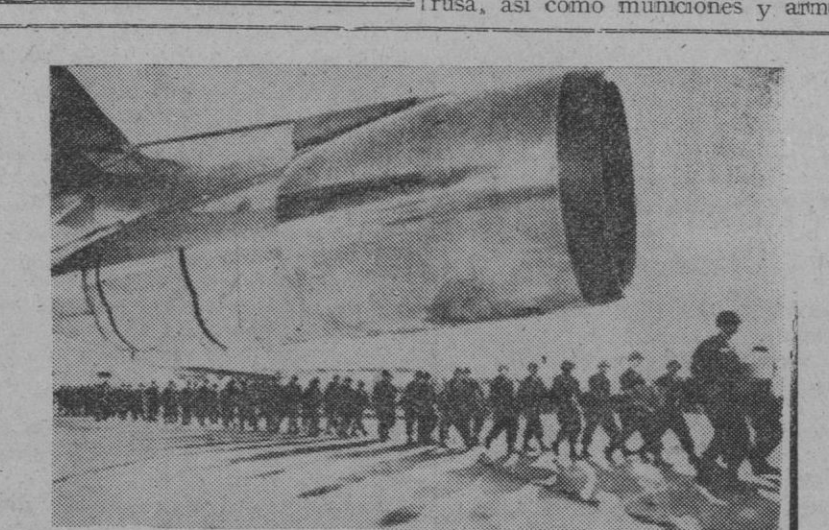
Pese al mal tiempo inicial, ha terminado la mayor operación militar aerotransportada de la historia, la "Big Lift", en la que el personal y el mando ligero de la Segunda División Acorazada de los Estados Unidos ha sido transportado, en gigantescos aviones a reacción y a través del Atlántico, desde sus bases norteamericanas a bases de Alemania, para participar en unas maniobras de la O. T. A. N. En la foto, los soldados dirigiéndose a los tetrareactores "C-130", en Tejas.

El monje llamado Dinhan, de 42 años, se roció primero de gasolina y luego se prendió fuego ante centenares de personas.