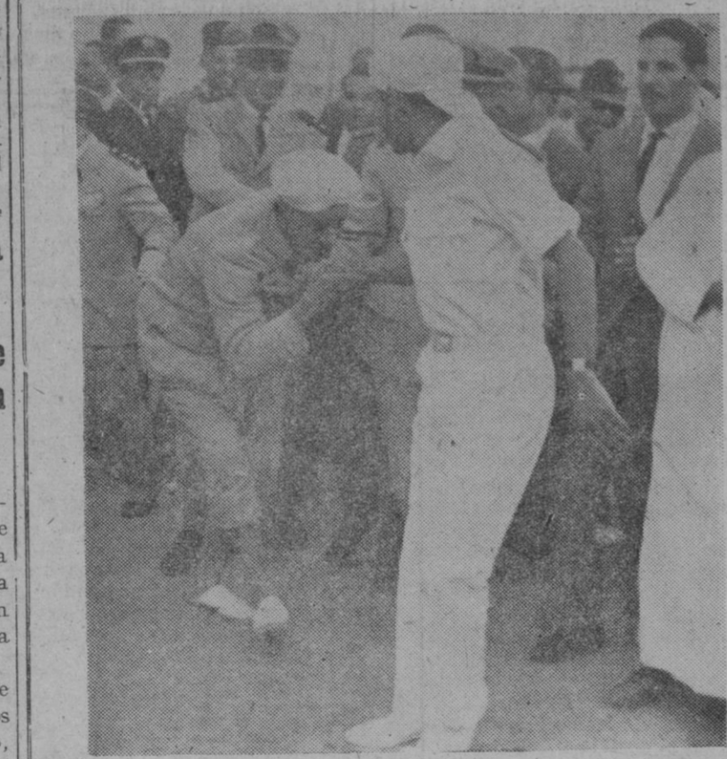
Más de cincuenta mil personas se congregaron en Mogador para recibir al rey Hassan II y hacerle patente su más incondicional adhesión. El viaje del soberano marroquí ha sido triunfal. En la foto, Hassan II recibe el homenaje del fervor popular.

A estas reuniones asisten, representantes vocales de toda España, en número de cincuenta.—Cifra.