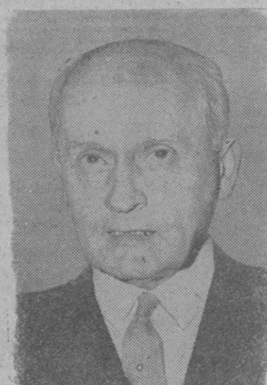
Pipinelis, primer ministro griego, que encuentra ahora graves dificultades con sus ministros

Palma de Mallorca, 21.—Pasa una temporada de vacaciones en Formentor la actriz inglesa Joan Plowright, segunda esposa del actor inglés Lawrence Olivier, acompañada de sus dos hijos de corta edad.—Cifra.