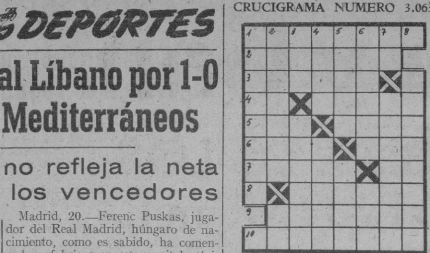
CRUCIGRAMA NUMERO 3.063

«Esto no significa que vaya a retirarme del fútbol», dijo. «El fútbol primario, las salchichas después.»