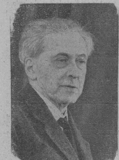
Ilya Ehrenburg, popular poeta ruso que se encuentra en la actualidad sometido a una fuerte crítica oficial

Londres, 17.—Todos los diarios dominicales británicos anuncian hoy la reclusión, en un sanatorio de enfermos mentales de la Unión Soviética, del escritor ruso Valeri Tarsis, que, entre otras cosas, publicó en Londres, en el mes de octubre pasado, con el seudónimo de Yvan Valery, la novela titulada «Red and Black» («Rojo y negro»).