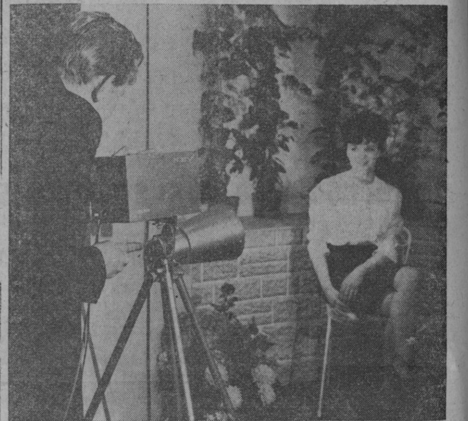
Se ha presentado recientemente en la Exposición Internacional de Instrumentos, Electrónica y Automatización, celebrada en Londres, una cámara de televisión en color y un monitor, ambos de bajo coste. El nuevo sistema, que es de circuito cerrado, se venderá a precios aceptables para los potenciales usuarios en los campos de la enseñanza, la medicina, el comercio, la industria y los espectáculos.

El Concilio Vaticano II es para presentar ante el mundo a la Iglesia de Dios con su perenne vigor de vida y de verdad.