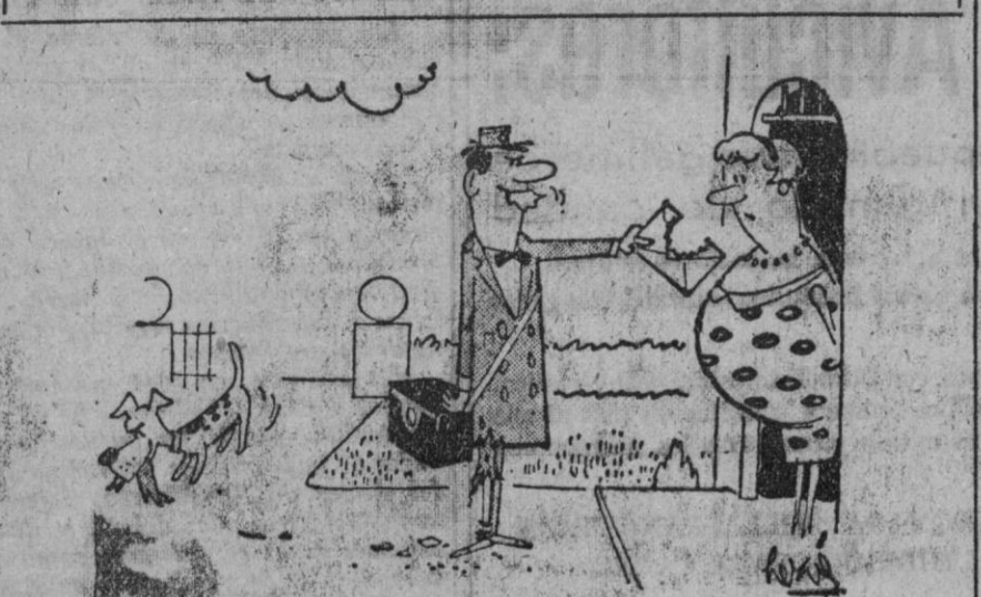
—Esta es mi venganza.