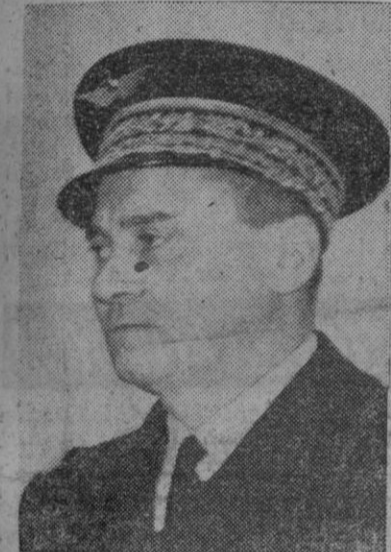
Edmond Jouhaud, número dos de los dirigentes de la O. A. S., internado en La Santé de París, tras su reciente captura en Argelia, y que será procesado de nuevo el día 11

Otros resultados de la jornada: Baloncesto, femeninos: D. U. de Madrid vence a Bilbao 45-27. Balonmano, masculino: Madrid vence a Oviedo 15-12. Fútbol: Barcelona vence a Sevilla 4-2.—Alfil.