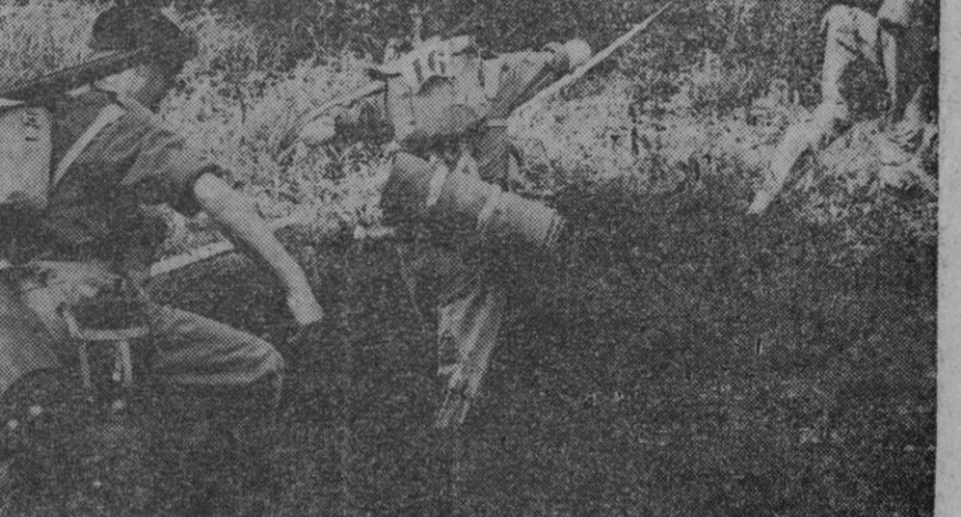
Estos «soldados de fin de semana», pertenecientes al Ejército Territorial en la zona alrededor de Londres, hicieron recientemente un duro ejercicio de dos días, en el que participaron veintisiete pelotones. Los jóvenes, que durante los días laborables tienen empleo civil, se pusieron de uniforme y cargaron a cuerdas todo el equipo. Iniciaron la maniobra con una «batalla», en la que dispararon fusiles y ametralladoras ligeras, cerca de Pybrigt, Surrey, y, tras cenar al aire libre, partieron de noche a campo traviesa, guiándose por compás. A la mañana siguiente, cruzaron el Támesis entre Slaines y Kingston, para luego recorrer quince kilómetros hasta los cuarteles de Mill Hill, donde les esperaba un duro curso de asalto. Después emprendieron la marcha final hasta Alexandra Palace, norte de Londres, donde fueron recibidos por dos bandas militares y cinco mil personas

Miembros de la O. A. S., atacan con fuego de mortero, desde Belcourt. Se han cometido otros ocho atracos, en bancos, garages, y establecimientos comerciales en Argel y Orán, los atacadores, miembros, al parecer, de la O. A. S., se apoderaron de un total de 260.000 francos nuevos.—Efe.