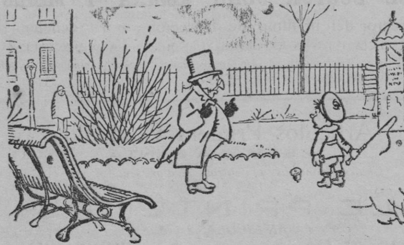
—Mucho cuidado hijo mío. El juego, es un vicio funesto.

Dado el pedido de localidades, se espera que en dicho teatro se reúna la mayor parte de la buena sociedad palmesana.