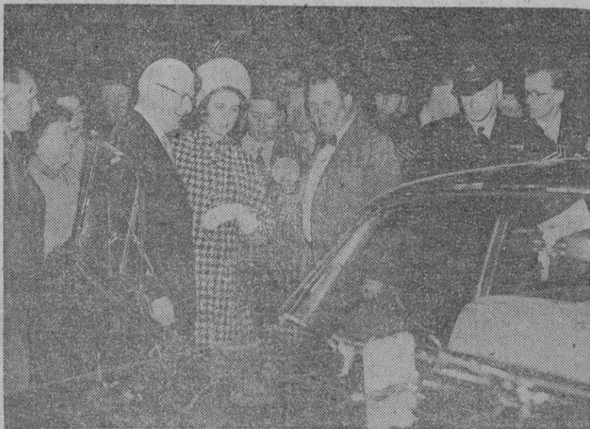
La princesa Alejandra de Inglaterra contempla un Jaguar 10, acompañada por el presidente de la Jaguar Limited, sir William Lyons, tras inaugurar el Salón Londinense del automóvil de este año. El concurso revela las realizaciones de un año de grandes innovaciones en esta industria. Se expusieron unos cincuenta modelos nuevos, de un total de trescientos cuarenta vehículos, de diez países

Berlín, 7.—Unos dos metros de la valla de cemento que separa los sectores oriental y occidental de Berlín, se han derrumbado a causa del intenso frío de anoche, según informa un portavoz de la Policía occidental. Las obras de reparación han dado comienzo esta mañana.—Efe.