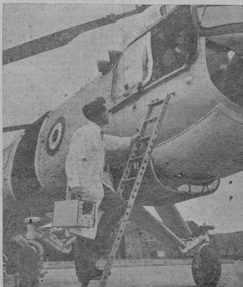
Un transistoscopio de baterías, colocándose a bordo de un helicóptero, para probar sus sistemas eléctricos. El transistoscopio, que pesa solamente seis kilos, es independiente del tendido principal eléctrico, y es ideal para comprobar circuitos de aeronaves sin llevarlas a los hangares

Sede de las N. Unidas (Nueva York), 1.—Delegados de los países árabes y comunistas han acusado a Gran Bretaña de intentar «someter» a las poblaciones de Omán, y han exigido a la O. N. U. ayude al país árabe a conseguir su independencia total. Los delegados han pedido que sea aprobada una moción patrocinada por 15 países para que Gran Bretaña retire sus fuerzas del territorio y que le conceda la independencia. Inglaterra ha negado que tenga intervención alguna en los asuntos internos de Omán. Mañana se procederá a la votación de la moción.—Efe.