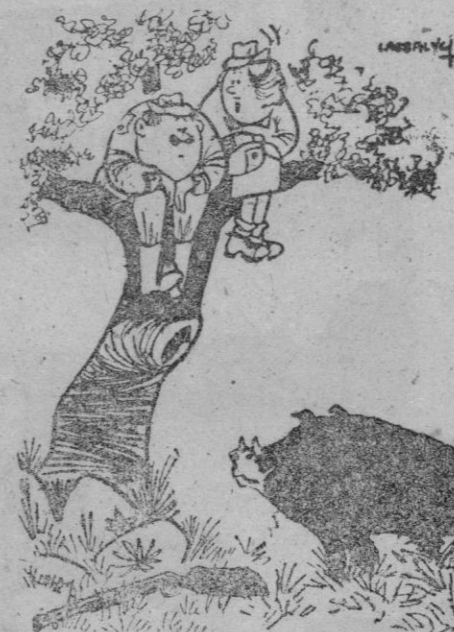
—Te ha reconocido. Es el mismo del año pasado.

BUTSIR cocinas a gas butano con bombona incorporada, desde 586 pesetas. DISTRIBUIDOR PROVINCIAL: CASA SOLERA