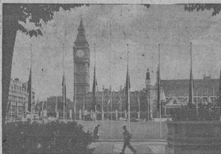
Las banderas de la Commonwealth en la Plaza del Parlamento de Londres, izadas con motivo de la séptima Conferencia Parlamentaria de esa comunidad, a media asta, por la reciente muerte de Dag Hammarskj6ld

El Gobierno de Velasco ha pedido apoyo a la poblaci6n, pero en varias ciudades se han registrado manifestaciones antigubernamentales y numerosos veh6culos y edificios han sido incendiados.—Efe.