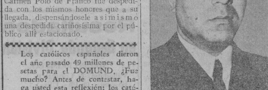
Maamun el Kuzbari, nuevo jefe del Gobierno y ministro de Negocios Extranjeros en el nuevo régimen de Siria