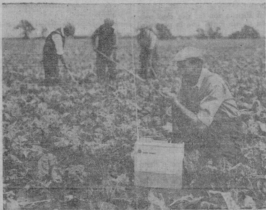
El capitán de una granja de Inglaterra utiliza un nuevo radiotelefono portátil para informar sobre el desenvolvimiento de las labores y para disponer el paso de la mano de obra de un trabajo a otro. Con un peso de nueve kilogramos y un radio de acción de algo más de treinta kilómetros—según el emplazamiento y la frecuencia usada—, el nuevo aparato se puede llevar a mano, pero tiene todas las ventajas de una instalación portada sobre vehículo. Se emplea ya en Canadá, Australia, Suiza, España, Austria, Singapur, Sudáfrica y Nigeria. El radiotelefono en versión normal funciona en un canal, a frecuencias de entre 25 y 174 megacíclos, en la banda de muy alta frecuencia, pero se puede suministrar para tres canales. La pila, de doce voltios y veinte horas-amperios, se fija en la parte inferior del equipo, intercambiándose rápidamente para ser cargado. Durante la transmisión, el aparato consume cinco amperios; en recepción gasta 1,25 amperios, y 2,3 amperios en escucha. Puede proveerse de pila más liviana, con zinc de plata.

Concediéndonos al tema comercial ganadero interior, hay que destacar la persistencia de la firmeza en precios; si bien en ferias y mercados de las provincias esencialmente cerealistas la concurrencia peca actualmente de floja como corresponde al período de máxima actividad en los trabajos de recolección. Quizá la nota más descolante sea el aumento ininterrumpido de la demanda de ganado porcino para aprovechamiento de espiga y reposición en montanera, hasta el punto de que los precios para salida de rastrojo oscilan entre 325 y 350 pesetas la arroba, lo mismo en Extremadura que en Andalucía. Las cotizaciones son especialmente «duras» en lanar para matadero.