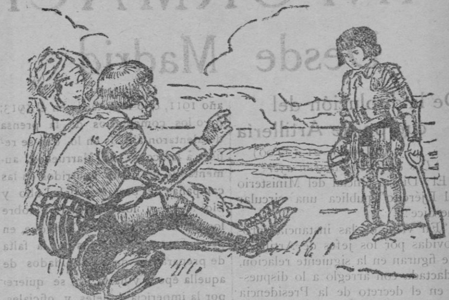
El verano en la edad media. El padre (al niño que está jugando en la playa).—Teodomirín mucho cuidado con mojarle, que se te va a oxidar el traje nuevo.

Estoy cierto de que el fausto acontecimiento del acuerdo con el Gobierno italiano contribuirá a dar más días de gloria al Pontificado, el cual podrá ejercer más intensamente su