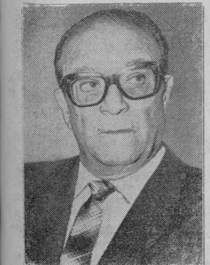
José Miró Cardona, presidente del Consejo Revolucionario Cubano, cuyo intento de derrocar a Fidel Castro ha fracasado con la reciente operación de desembarco en Cuba

Estocolmo, 2.—El jefe del Gobierno cubano, Fidel Castro, es probable que marche muy pronto a Moscú para recibir el premio Lenin de la paz, que le ha sido recientemente concedido, según informa desde la capital soviética la agencia Tass. Castro dijo a un corresponsal de la Tass en La Habana que consideraba el premio «como un gran honor para su pueblo que ha luchado contra el imperialismo agresor.»