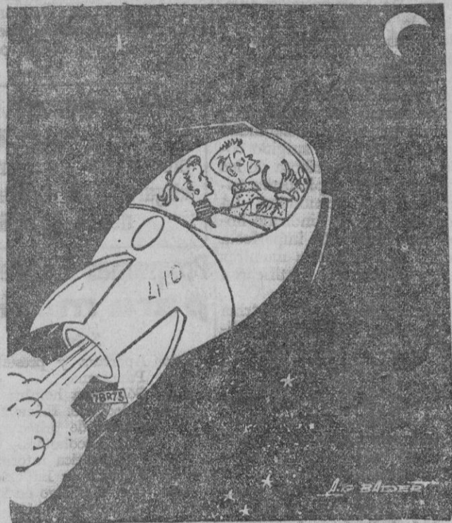
—Vamos... estamos bien; hoy no se puede aparcar más que en un solo lado...