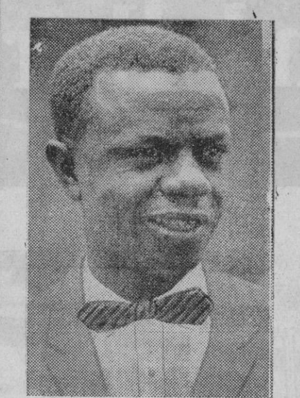
Joseph Ileo, primer ministro nombrado por Kasavubu para el Gobierno provisional del Congo

Katanga, blanco o negro, que lo solicite.