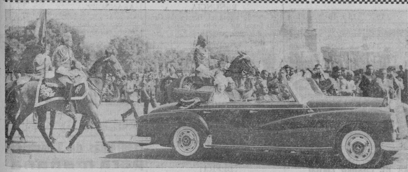
Isabel II de Inglaterra y el presidente de la India, Rajendra Prasad, se dirigen juntos y en automóvil hacia el Palacio presidencial, escoltados por lanceros de la guardia del presidente, en uniforme de colores rojo, negro y oro, a raíz de la llegada de la reina y el príncipe Felipe a la capital india, iniciando su visita de Estado. Cerca de dos millones de personas se aglomeraron a lo largo de la ruta del desfile para tributar su entusiasta bienvenida a la real pareja.

La Paz (Bolivia), 22.—El Gobierno ha ordenado la detención de ochenta y cinco personas con arreglo a una «ley de urgencia» impuesta para contrarrestar supuestas actividades subversivas de los comunistas y de otros grupos de la oposición, según ha anunciado el Ministerio del Interior. El presidente boliviano, Víctor Paz Estensoro, ha declarado en una conferencia de prensa que el Gobierno no proyecta, «por el momento», imponer restricciones a los periódicos de Bolivia, y añadió que el país está «completamente en calma». Aunque se cree que Walter Guevara Arce, líder de la facción «auténtica» de la oposición gubernamental, ha logrado evadirse de la acción del Gobierno, lo cierto es que se desconoce su paradero. Un portavoz de Guevara había declarado a la United Press International que el líder de la oposición se encontraba en la ciudad de Cochabamba. Otras fuentes señalaban que había huido del país. Las referidas fuentes han manifestado también que las fuerzas de Seguridad del Gobierno han detenido a un lugarteniente de Guevara, Jorge Ríos Gamarra. El Gobierno ha acusado a los partidarios de Guevara de conspirar con los comunistas para provocar una revolución. Guevara fue derrotado en las elecciones presidenciales de junio pasado, en las que Paz Estensoro volvió al poder.—Efe.