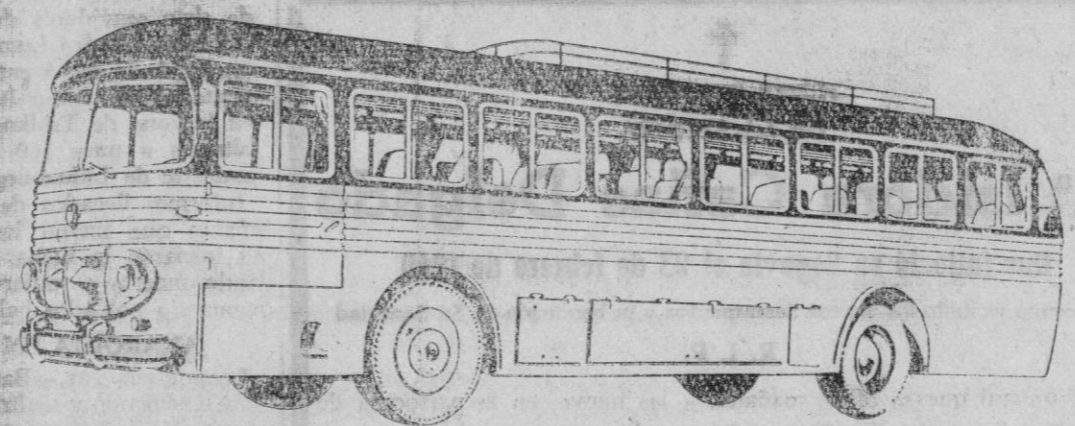
AUTOCAR CON MOTOR DE 120 CV. CARROCERIA METALICA

Peso del autocar a plena carga: 10.500 kilos