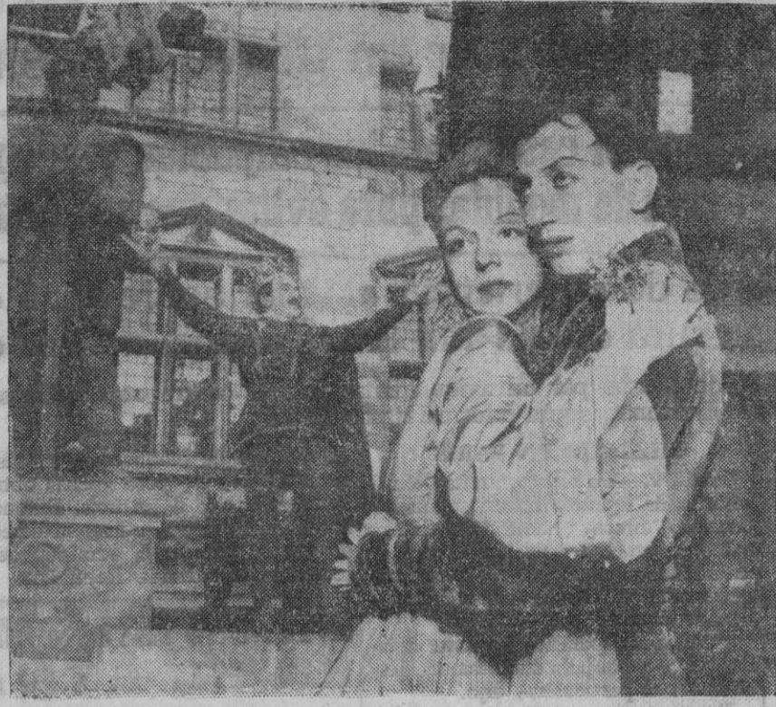
En la historia del teatro europeo ya hay otros precedentes de actuaciones de compañías norteamericanas. Así, por ejemplo, la del Virginia State Theatre, de Nueva York, que en el castillo de Kromborg, en Elsinor, representó "Hamlet".

Servicio autorizado Diesel MATA CAS Independencia, 11