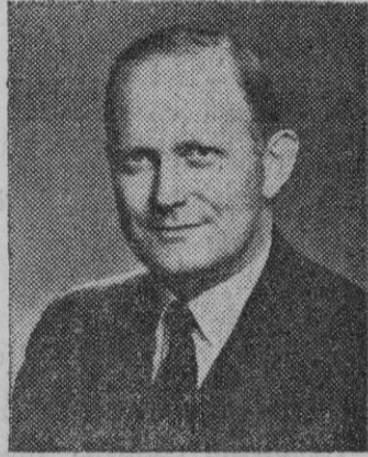
C. Douglas Dillon, secretario norteamericano del Tesoro

Washington, 10.—El presidente Kennedy ha nombrado a Douglas Dillon secretario del Tesoro, para el cargo de gobernador del Fondo Monetario Internacional y del Banco Mundial.