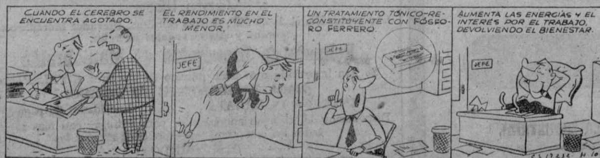
FÓSFORO FERRERO, SUPERALIMENTO DEL SISTEMA NERVIOSO, MANTIENE SU PRESTIGIO.