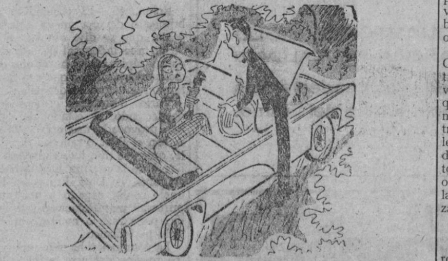
—¡Te aseguro que es una avería de verdad y necesitas la llave inglesa para repararla!

RELOJ MASAGO Prestigia a quien le regala Distingue a quien le recibe Gran Relojería ATALAYA Avda. F. Ladreda, 9.