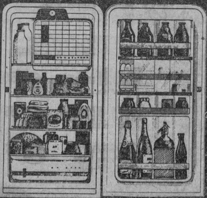
Modelo 177 litros de capacidad útil de almacenaje

Ud. podrá conservar los alimentos con toda su frescura y valor nutritivo.