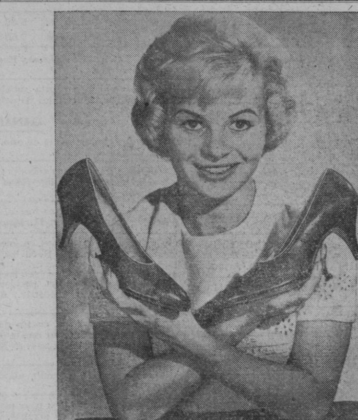
¡Por fin!... he aquí los zapatos intercambiables, ideales para las señoras que tienen prisa o que se quieren calzar los zapatos a oscuras. Diseñados con gran habilidad, estos zapatos se ajustan perfectamente a cualquiera de los dos pies.

La «foto» en cuestión, tomada por un misionero el 5 de Noviembre de 1949, muestra al hombre de las nieves con el cuerpo cubierto con espeso pelo. En el pie de la «foto» se dice que el Padre Franz Eichinger, miembro de una misión del Tibet, se encontró con la extraña criatura durante un viaje por el valle de Hokka, en la provincia de Chinghai.—Efe.