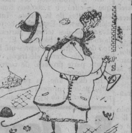
—No entiendo bien... ¿Qué me dices?

Los sapos forman en primavera grandes colonias viajeras que son a menudo víctimas de los grandes ignorantes. Estas colonias, compuestas de centenares y aún de miles de individuos, abandonan en la época de la postura (abril y mayo) sus habitaciones de invierno y verano para ir a reconcentrarse en una sola charca y a este objeto se ven obligados muchos de ellos a recorrer grandes distancias que a veces llegan a siete kilómetros. Después de la postura, los sapos se dispersan y vuelven a sus antiguas viviendas. La gente interpreta estas aglomeraciones como batallas y dispersa a los sapos matando gran cantidad de ellos. Así han desaparecido un gran número de colonias. Los naturalistas aconsejan poner fin a estas matanzas en consideración a los grandes servicios que prestan a los agricultores los sapos.